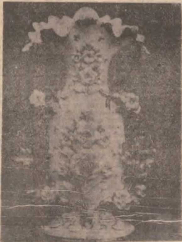
VAZĂ CU TRANDAFIRI

stânjenel, care urmează concentrându-se spre bază, dând senzația unei alte flori ale cărei frunze și petale învăluie personajul feminin.