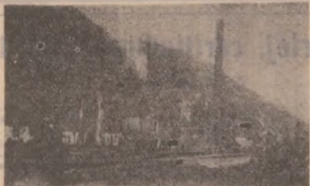
De la farmecul desuet al începutului...

prezintă datorită marilor colosi industriali la bugetul de stat. Așa a apărut ineficiența legislației economice incapabilă să regleze lucrurile acolo unde realitatea obiectivă din teren se opune corijărilor spre eficiență. Mediul economic românesc a devenit, din cauza marilor operatori economici a căror ineficiență s-a moștenit după 1989, odată cu structura lor pantagruelică, un domeniu al nisipurilor mișcătoare, imaginea acestor colosi industriali cunosând o continuă degradare în percepția opiniei publice.