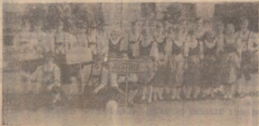
Membrii ansamblului folcloric austriac zămbind aparatului fotoreporterului nostru, la o ediție precedentă a festivalului.

desfășurată azi, 8 august, ora 17,00, la Casa de Cultură Deva, spectacolele vor fi susținute în zilele următoare în localitățile Hațeg, Geoagiu — Băi, Costești, Șimeria, Brad, Călan, Orăștie. În ziua de 13 august, ceremonia de închidere a festivalului va fi la Hunedoara, la spectacol contribuind toate formațiile participante. (V. Roman)