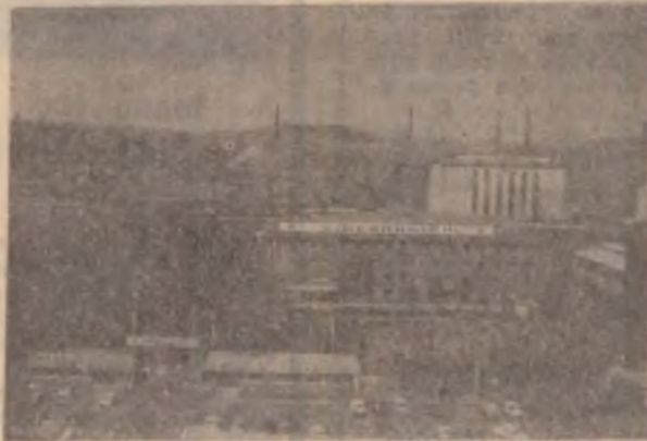
...la impozanța de astăzi.

Siderurgica S.A. contează acum pe o piață de desfacere ce însumează cca 900 de mil de tone de oțel anual. Din această cifră, piața internă absoarbe 560 de mii de tone, fiind cerute semifabricatele pentru țevi (13,4% la sută), profile grele (32 la sută), profile ușoare (32,5 la sută), rulmenți, oțel beton și diferite organe de asamblare. Cca 300 de mii de tone de oțel produs la Siderurgica ia anual calea expor-