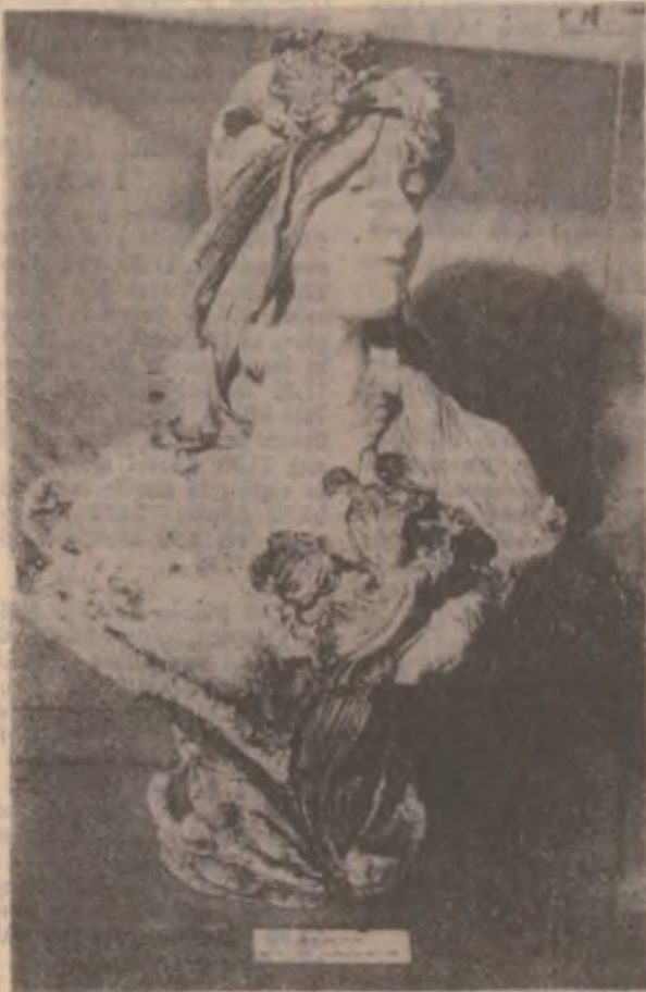
BUST DE TANĂRA FEMEIE

drul expoziției piese aparținând atelierelor europene, produse în Franța, la Sarreguemines, în Anglia, Cehoslovacia, în Germania — Rosenthal, Kronach, Haidinger și Ilmenau, iar, în ultima sală, piese aparținând unor ateliere orientale. A consemnat GEORGETA BÎRLA