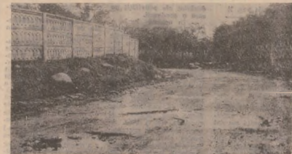
Așa arată traseul Riu de Mori — Suseni: plin de gropi ce rețin apa pluvială, adevărate capcane pentru cei care merg cu mașinile să viziteze Schitul Colț.

Discutând cu mai mulți agricultori — cultivatori de grâu —, aceștia și-au arătat în mod deschis îngrijorarea în legătură cu situația semințelor de cereale păioase necesare pentru anul viitor. Pe bună dreptate, îngrijorarea lor