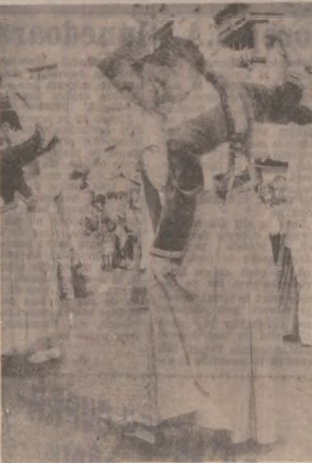
Dansatori din Țara Bascilor.