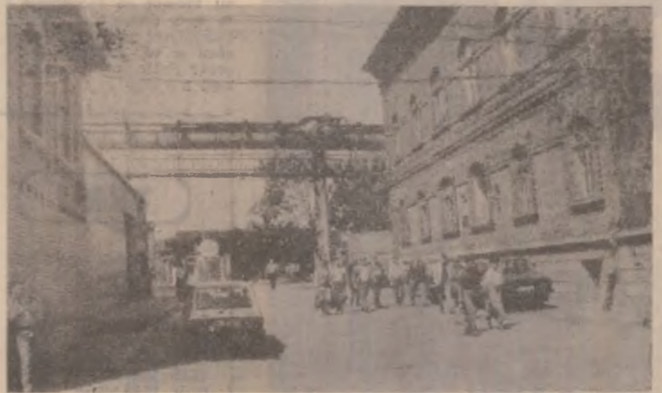
„Siderurgica” Hunedoara. Poarta mare.