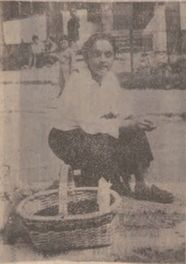
Semințe de floare, vă rog, semințe...

Pentru al treilea an consecutiv, elevii hunedoreni premiați la faza națională a olimpiadelor școlare beneficiază de o atractivă excursie peste hotare. Prin grija Inspectoratului Școlar al Județului Hunedoara, respectiv prin contribuția Ministerului Educației Naționale și a Ministerului Tineretului și Sportului, cei 28 de elevi premiați în acest an au plecat deja spre Spania, destinația actualii excursii ce se va finaliza în 21 august. (G.B.)