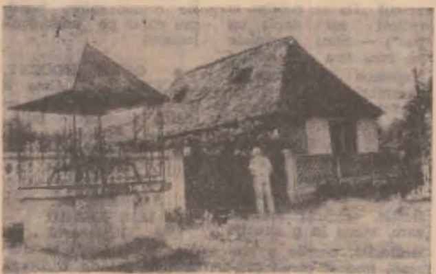
Casă veche, cu fântână, din Răcăștie.