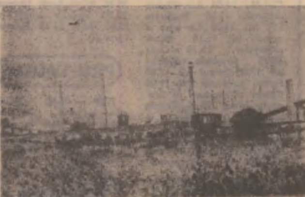
La Hunedoara, agricultura se îngemănează cu metalurgia.