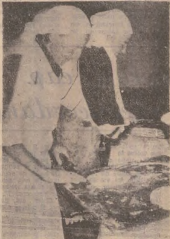
Socăcițele din Poienița Voinii.