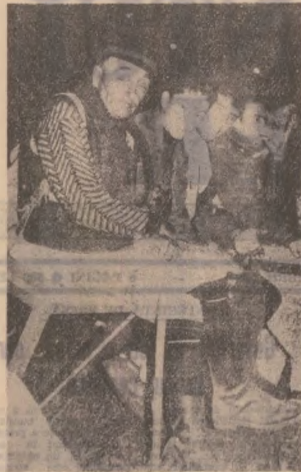
Alături de finerețe uși de problemele bătrâneții.

Cum aflăm de la dna de flori din Deva se face inginer Francisca Viorica în prezent și reparații cu Cristea, pe lângă lucrările la câteva ateliere rile obișnuite de pregătire vor intra din nou în producție. Se construiesc de asemenea un nou sediu pentru — primăvara, la Serele birourile serci. (E.S.)