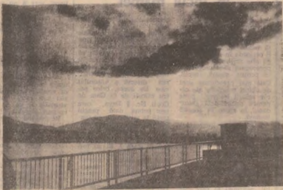
Baraj pe Riul Mare.

În limita timpului disponibil îi spunem, de asemenea, dlui D.N. că răspunde invitației ce i-a adresat-o pentru a cunoaște, de la sursă, cum se spune, problemele cu care se confruntă oamenii satelor. Oricum, și mulțumim pentru scrisoarea pe care ne-a adresat-o, sperând că l-am ajutat să dezlege misterul cu suma în cauză să fie dezlegat și clarificat. (N.T.)