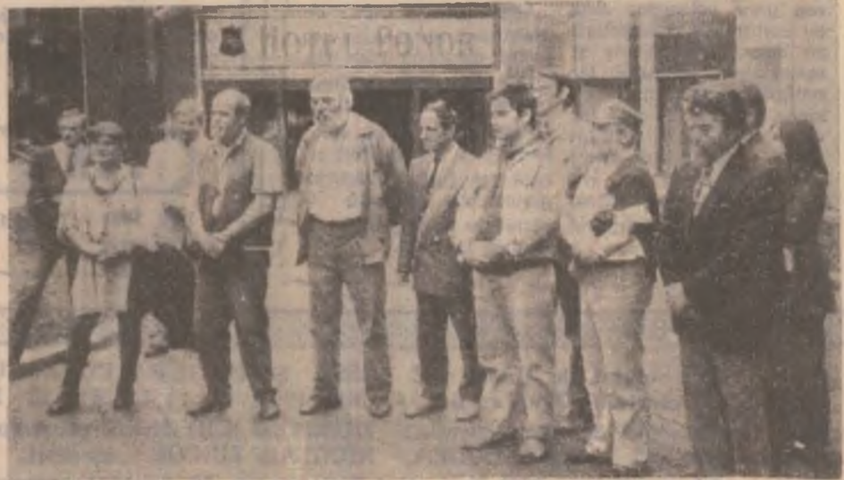
Artiștii plastici participanți la Tabăra națională de sculptură Vața Băi '97.