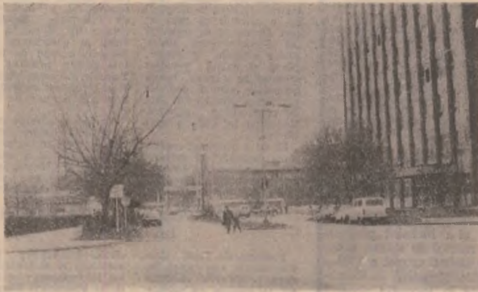
La poarta siderurgiei hunedorene.

cuvine de cinefilii hunedoreni, sala supraplină amintind în aceste cazuri de vremurile „bune” de altădată. În cursul anului trecut s.a reușit finalizarea unei investiții prin care cinematograful și-a amenajat o centrală termică proprie, care să asigure pe perioada sezonului rece un confort termic satisfăcător în sală. Se intenționează pe viitor achiziționarea unor calorifere moderne, care să completeze puterea de radiație a celor existente.