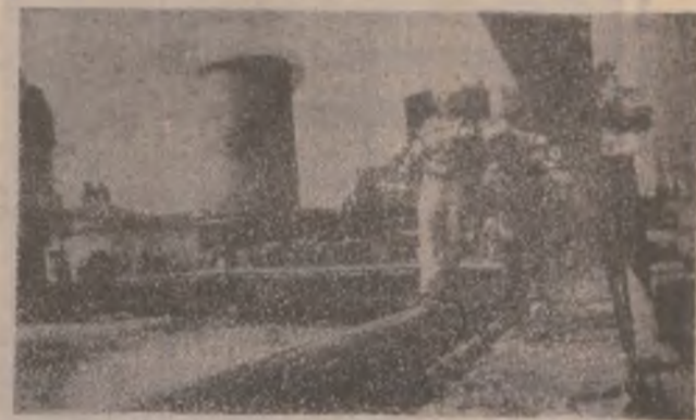
Aspect industrial hunedorean.