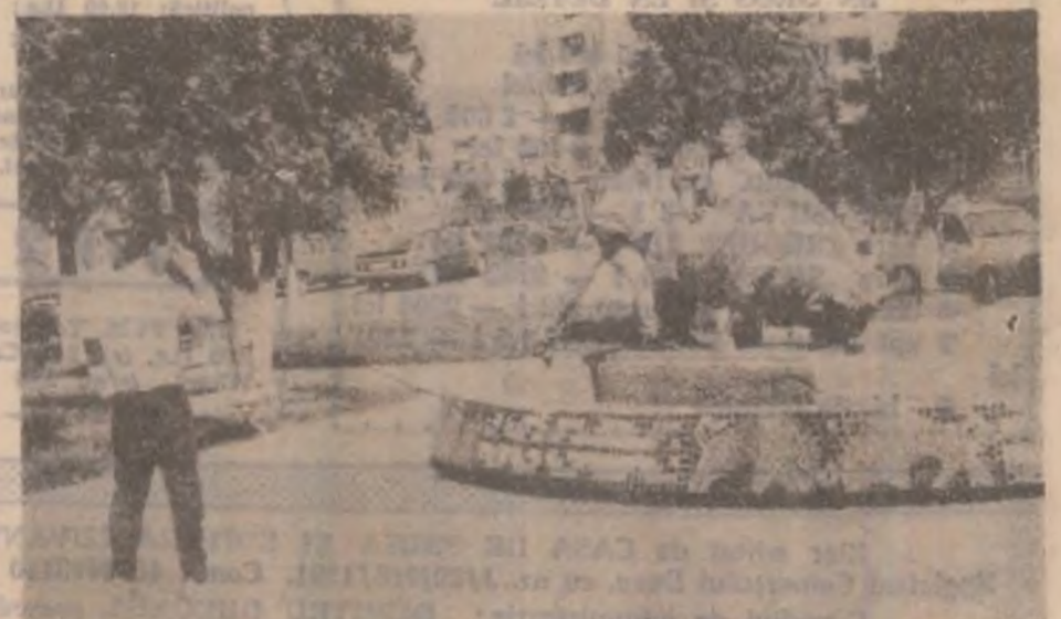
O amintire plăcută din orașul Hațeg pentru tinerii turiști englezi.