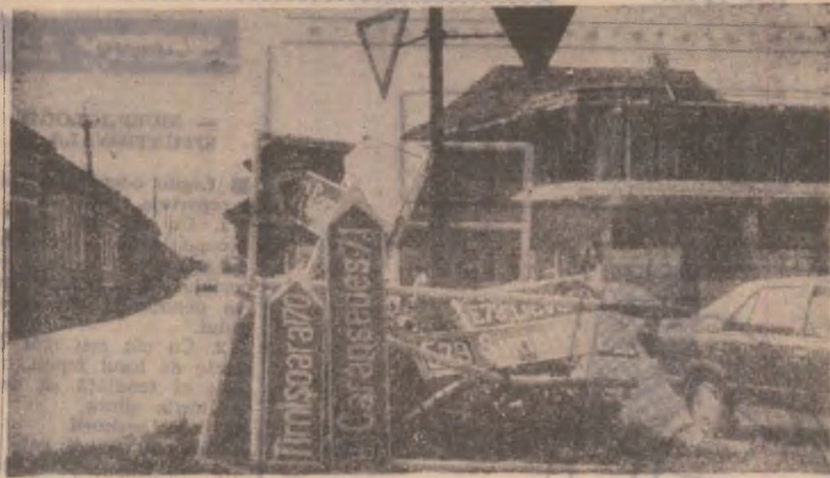
„Toate drumurile duc la Roma” sau la ce poate duce nesăbuința unui conducător auto.

Cu prilejul Zilei pompierilor, joi, la Deva, a avut loc o ceremonie dedicată acestei sărbători. Au participat reprezentanți ai Prefecturii și Consiliului Județean, ai unor instituții județene și locale, precum și ai unor societăți comerciale.