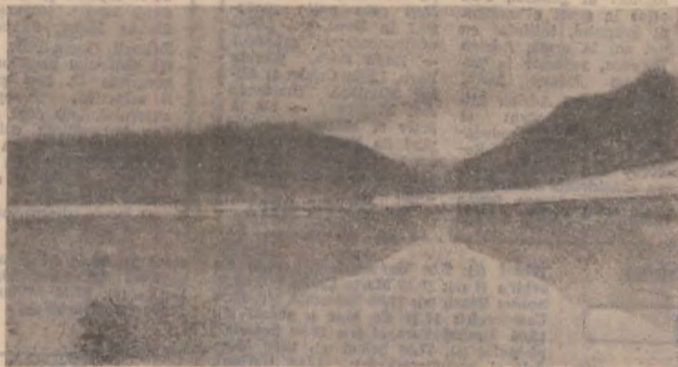
Riul Marc Retezat. Lac de acumulare.