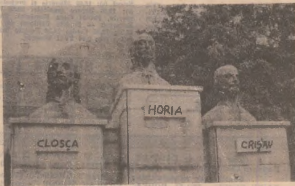
Busturile lui Horia, Cloșca și Crișan, situate în fața Muzeului Civilizației Dacice și Romane din Deva.