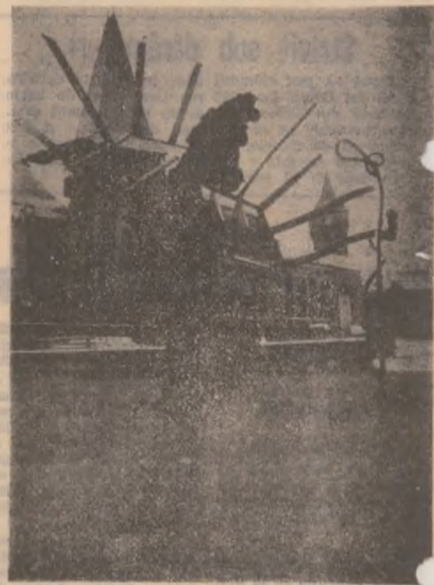
Castelul Corvineștilor