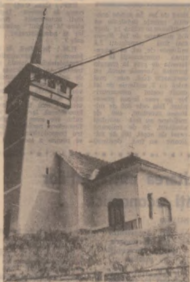
Biserica ortodoxă din Blăjeni.

Hotărârea 30/1983 nu se mai ia ca referință, dar cei cu care am luat legătura ne-au spus că există norme de aplicare a legii la care ne-am referit. Dacă locuții la parter, este firesc să nu plătiți o cotă parte a energiei electrice pentru funcționarea liftului, dar, dacă la etajele superioare sunt amplasate spații comune de folosință, toți cei care le folosesc au obligația să contribuie.