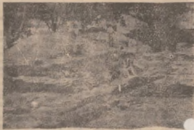
Săpături arheologice în preajma clădirii Magna Curia, sediul Muzeului Civilizației Dacice și Romane din Deva.

încă serioase greutăți în executarea lucrărilor din campania de toamnă, în mod deosebit a arăturilor, datorate în special lipsei banilor la unitățile Agromec și la fermele de stat, pentru procurarea motorinei, lubrefianților, pieselor de schimb și altor materiale. Cum soluția de a apela la credite este mult prea păguboasă, unele unități fiind în plus și lipsite de vocație la credite rămâne nădejdea că fiecare prestator de servicii în mecanizarea agriculturii va găsi modalități pentru a face față solicitărilor și a depăși impasul în care se află.