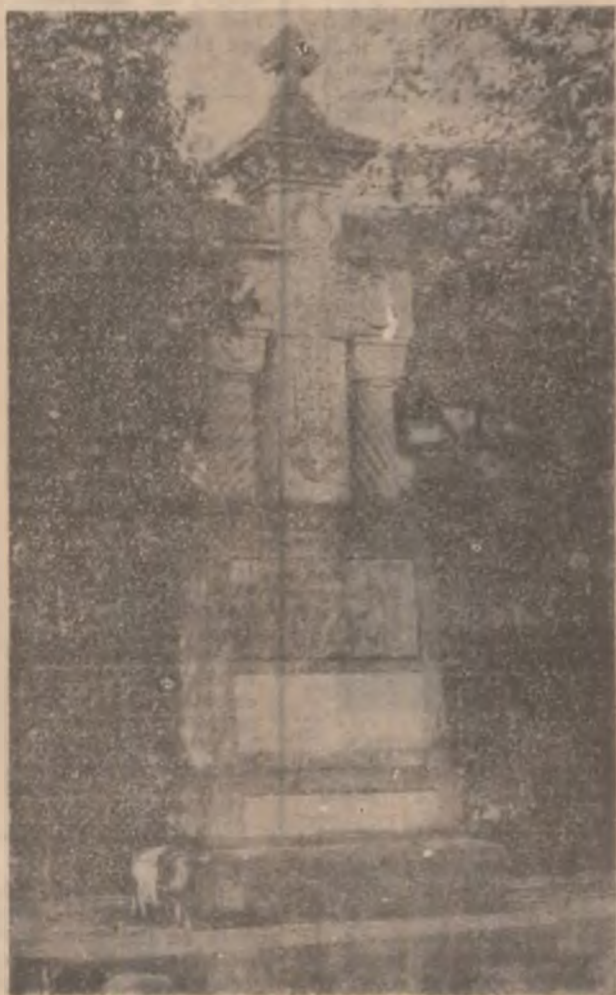
CRISCIOR. Monumentul eroilor.