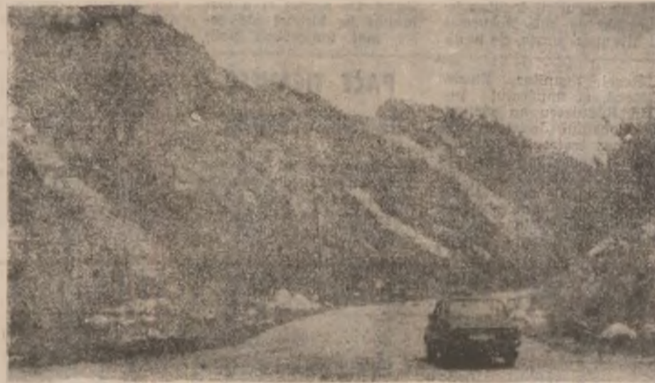
De la Hunedoara-nsus, spre Poiana Ruscăi.

alocării din Bugetul local a sumei de 8 milioane lei, pentru organizarea simpozionului „Hunedoara — vatră de istorie, cultură și civilizație”, ediția a treia; efectuării din bugetul local a cheltuielilor ocazionale de vizita delegației din orașul înfrățit Szombathely (Ungaria), 11—14 octombrie 1997. S-a realizat, de asemenea, o informare privind învățământul preuniversitar din municipiul Hunedoara în anul școlar 1997—1998.