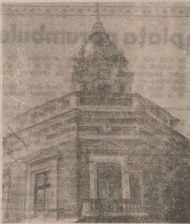
DEVA. Centrul vechi — turnul cu ceas.

fabetizați în tărâmul culturii civice. Dar ei au depășit de mult vârsta școlii, cine să le deschidă mințile acum dacă nu presa? Nu literatura, fiindcă o carte îi obosește. Dar ziare, de bine, de rău, citesc și, mai ales, stau cu ochii proptiți în terbelizor, fremetând la vederea „tribunului”. Iată însă că presa, și mai ales televiziua, mizând excesiv pe modelele joase, își ignoră rolul educativ, de modelare pozitivă a mentalităților. În pas cu zorii noului mileniu. E un simptom de imaturitate. Fără să știe să selecteze știrea cu adevărat importantă, evitând postura ridicolă a personajului