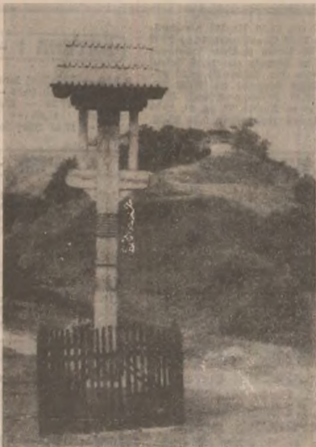
POIENITA VOINII, troiță.