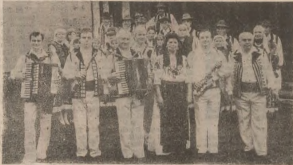
Ansamblul artistic al Casei de Cultură din Hunedoara.

Acest sfârșit de săptămână (11-12 oct.) va găzdui la Deva o nouă ediție a tradiționalei manifestări dedicate artei populare românești — „Târgul meșterilor populari”. Ceramică, cusături, țesături și alte diverse obiecte de artă populară autentică, din cele mai reprezentative zone ale țării (Obârșu, Corund Horezu ș.a.), vor putea fi nu doar admirate, ci și achiziționate de colecționari, de cei care apreciază arta populară românească la adevărata sa valoare. (G.B.)