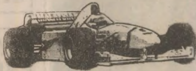
Texaco Havoline Formula 3 - Sponsorii Formulei 1 în Europa

Dumneavoastră sunteți genul de șofer care pretinde de la uleiul de motor înaltă performanță zi de zi. De ce? Pentru că asta contează cu adevărat pentru dvs... Iată de ce ar trebui să folosiți același ulei pe care îl folosesc și mașinile de Formula 1.