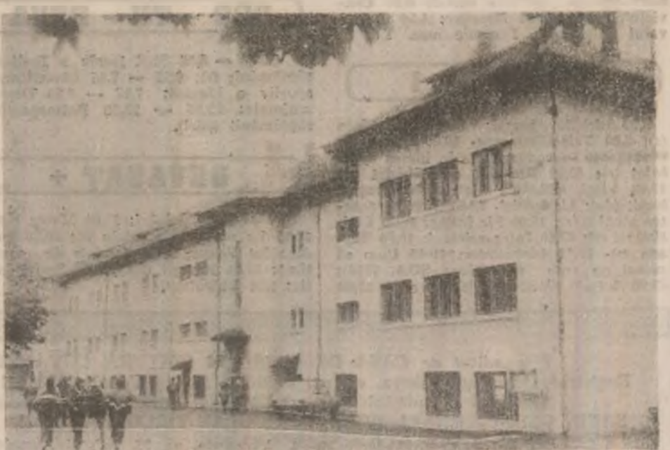
Grupul Școlar Agricol Geoagiu.

● „ROCK PE PÂINE. Mare atracție, mare, sâmbătă (18 oct. a.c.), pentru tinerii iubitori ai rock-ului hunedoreni; pe platforma din Piața Obor a municipiului Hunedoara, începând cu ora 17, va evoluca în recital binecunoscutul grup rock COMPACT B. În deschiderea spectacolului, organizat de Radio Color și de Fabrica de pâine UZO Balcan, va cânta grupul devenit „Profetul”, iar în finalul său cei prezenți vor putea dansa în cadrul discotecii „Radio Color”. (G.B.)