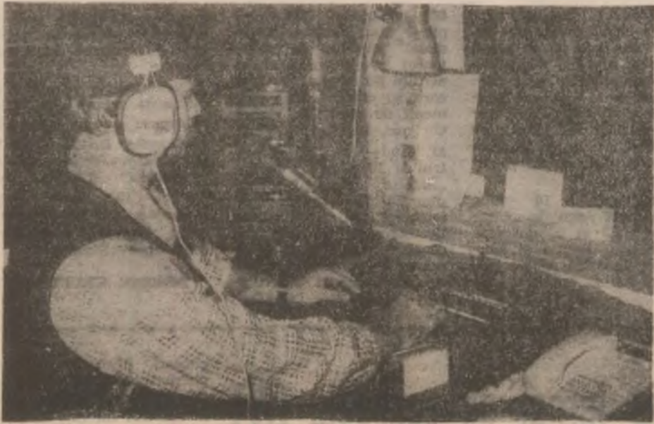
Din studioul Radio Color Orăștie.

— Cel privind mentalitatea oamenilor. Mai trebuie să treacă ani buni pentru a schimba, mai cu seamă, în privința efectuării și păstrării curățeniei. Doar atingându-i la bani, vor învăța să păstreze. În rest, să știți că nu mă supăr dacă scrieți negativ referitor la ceea ce surprindeți. Dimpotrivă.