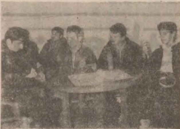
În pauză, elevii Grupului Școlar Agricol Geoagiu, pot servi, din acest an școlar, un suc sau o gustare.

Ultima noutate, prezentată cu mândrie de dl, director, este chioșcul propriu de incintă, unde elevii găsesc dulciuri, covrigi, brânzoaice, gogoși, sucuri și cafea și lângă care s-a amenajat o sală în care își pot servi gustarea în condiții civilizate.