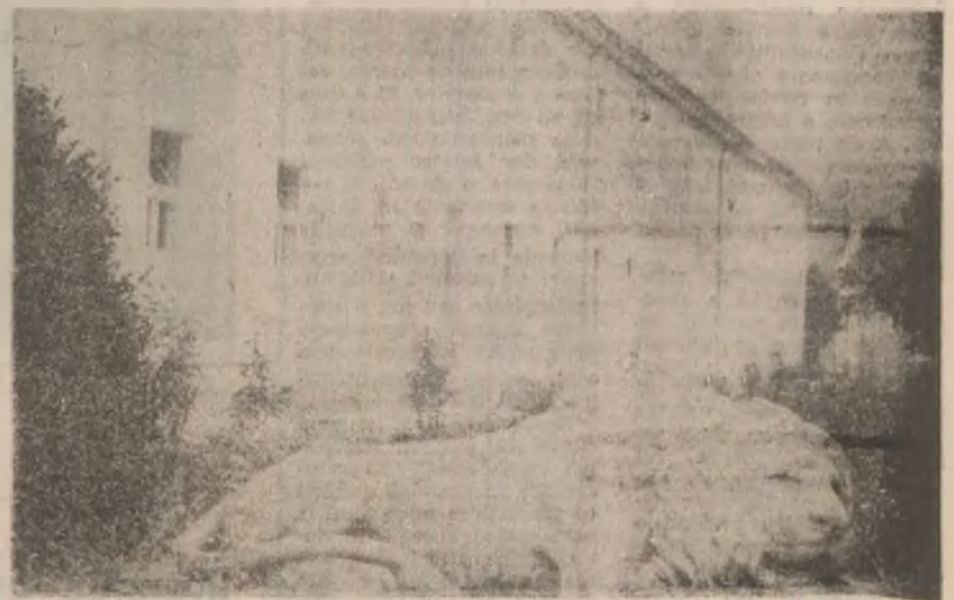
Somnolența ce cuprinsese totul în jur, într-o zi cețoasă de toamnă, părea să-l fi molipsit și pe leul de piatră ce străjuiește Sanatoriul T.B.C. Geoagiu.