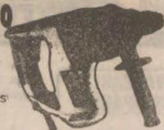
BORMAȘINA KRESS PSX 550 550 W, 22 mm