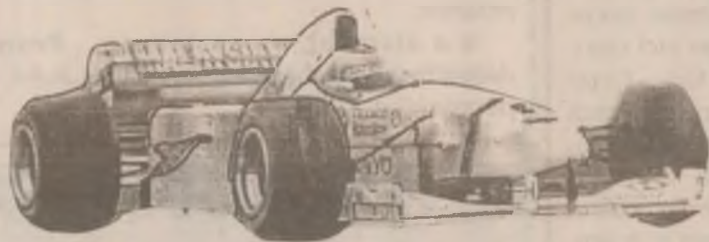
Texaco Havoline Formula 3 - Sponsorii Formulei 1 în Europa

Dumneavoastră sunteți genul de șofer care pretinde de la uleiul de motor înaltă performanță zi de zi. De ce? Pentru că asta contează cu adevărat pentru dvs... Iată de ce ar trebui să folosiți același ulei pe care îl folosesc și mașinile de Formula 1.