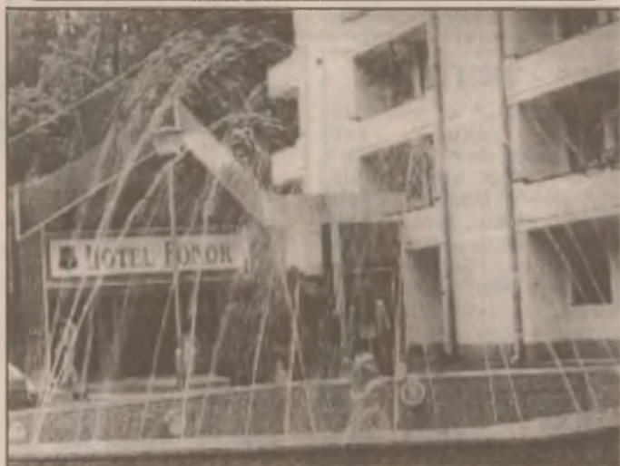
Aspect din stațiunea Vața de Jos

Cursurile incluse în această listă au la bază cotații ale societăților bancare autorizate să efectueze operațiuni pe piața valutară. Prezentarea listă nu implică obligativitatea utilizării cursurilor în tranzacții efective de schimb valutar și înregistrări.