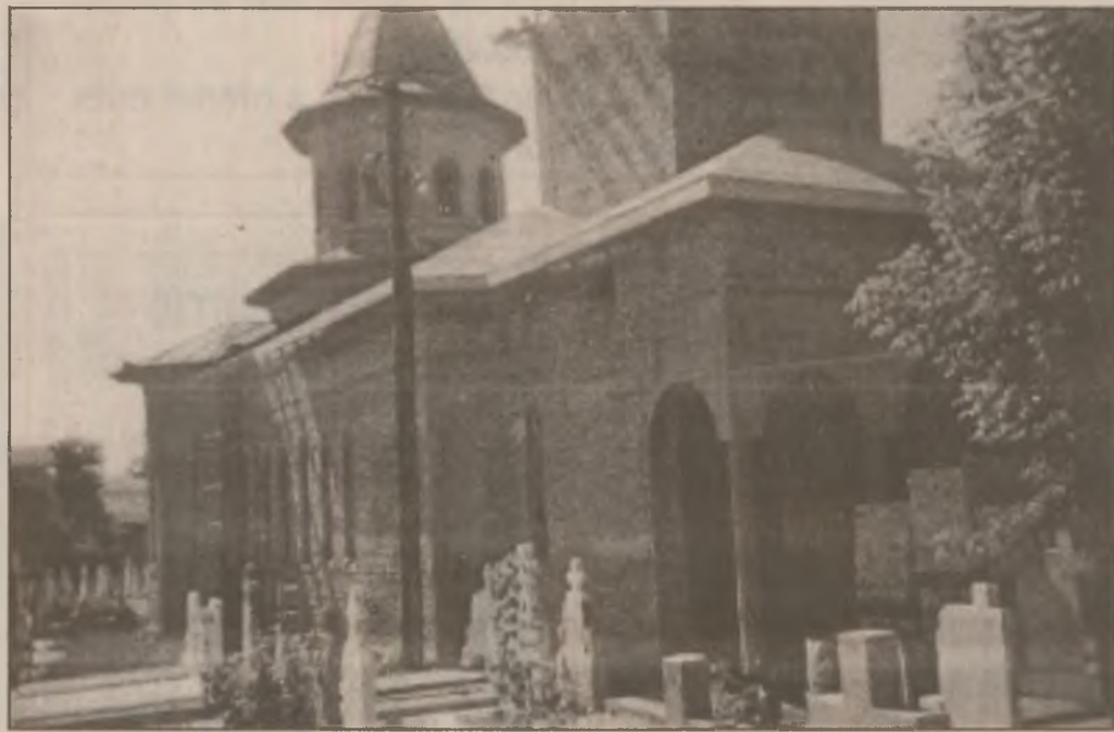
Biserica cu hramul „Sf. Vasile” din str. M.Eminescu - Deva