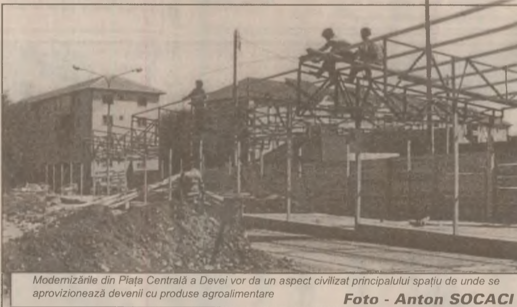
Modernizările din Piața Centrală a Devei vor da un aspect civilizat principalului spațiu de unde se aprovizionează devenii cu produse agroalimentare