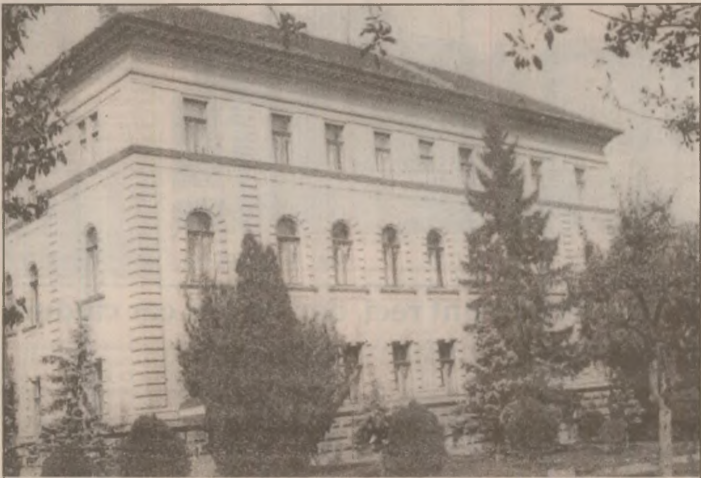
Clădirea Tribunalului Hunedoara. Aici își are sediul redacția ziarului "Cuvântul liber"

Când grijile îl împing pe om la târg să vândă sau să cumpere, fiecare se gândește să facă o afacere bună. Dacă reușește sau nu asta rămâne să fie constatat după ce ziua s-a încheiat și a ajuns cu bine acasă. În rest, ca la orice târg, de bucurie sau de nechez, s-au mâncat mici, s-a băut bere și alte spirtoase.