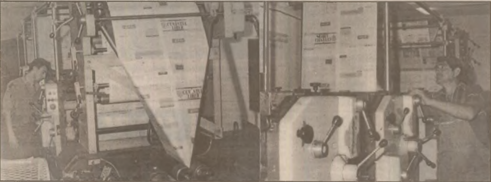
Pe această mașină sofisticată prinde forma finită ziarul "Cuvântul liber". Tiparul executat la Imprimeriile "Unirea Pres" Alba Iulia

Și fosta putere se credea instalată pe viață. Dar viața are și legi dure. Să nu le ignorăm.