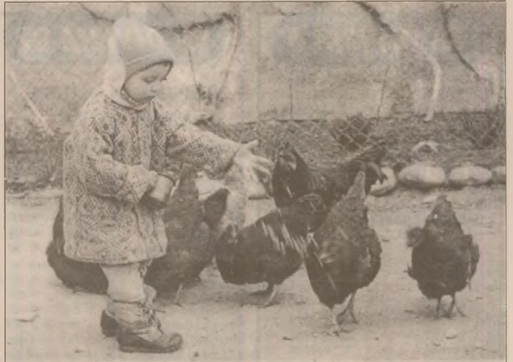
Dacă din partea Avicolei este slabă nădejde să mai vină carne și ouă, el învață de mic lecția economiei de piață, descurcându-se cum poate, cu forțe proprii.

În context făcea referire la necesitatea de a fi reabilitată cultura cartofilor, având în vedere că în zonă se produceau câteva mii de tone de cartofi pentru sămânță. Pe lângă o mai bună dotare, se resimte acut și nevoia de asociere pentru lucrarea pământului pe tarlale compacte, unde să fie respectate și tehnologiile specifice, astfel nefiind de conceput practicarea unei agriculturi de performanță.