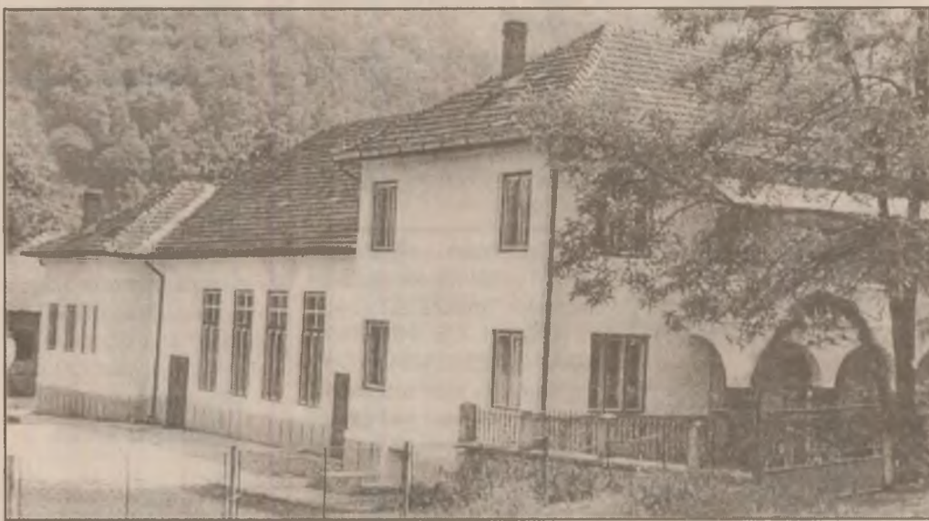
În imagine: Căminul Cultural din Zdrapți.