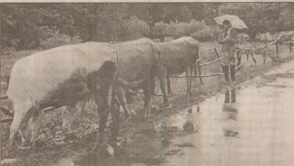
Pe vreme bună sau rea, animalele trebuie duse la pășunat

prin fabricarea și vânzarea pâinii. Mai dificil este însă cu valorificarea producției de porumb de pe 50 de ha, estimându-se o recoltă de peste 200 tone boabe. Până la găsirea unui beneficiar și a ofertei de prețuri acoperitoare pentru ca agricultorii să nu rămână în pagubă, asupra rezultatelor muncii producătorilor agricoli continuă să planeze incertitudinea. Din păcate, o asemenea situație nu este singulară, ea fiind aproape generalizată, ceea ce ridică serioase semne de întrebare în legătură cu politica agricolă, care nu ține seama de interesele proprietarilor de pământ, de posibilitățile reale de a valorifica, în raport de cerințele pieței interne și externe, potențialul agriculturii românești.