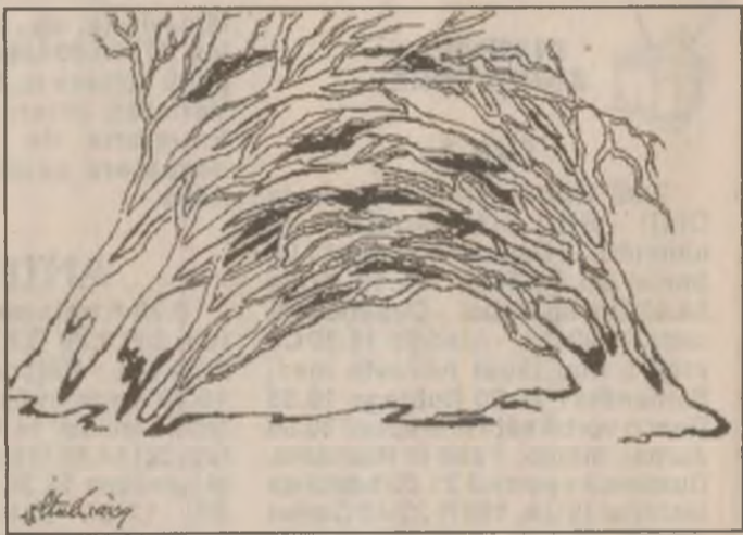
Desen de Dorina Itul Crâng