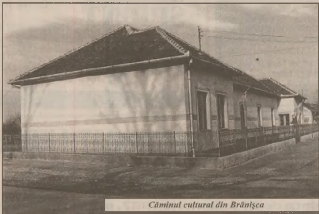
Căminul cultural din Brănișca

votarea în plenul Parlamentului a miniștrilor care vor fi numiți în eventualitatea unei remanieri guvernamentale. Frunda a amintit că a sesizat, în timpul guvernării Văcăroiu, Curtea Constituțională, împreună cu alți parlamentari ai fostei opoziții, cerând interpretarea articolului din Constituție referitor la remanieră. Răspunsul Curții a confirmat poziția fostei