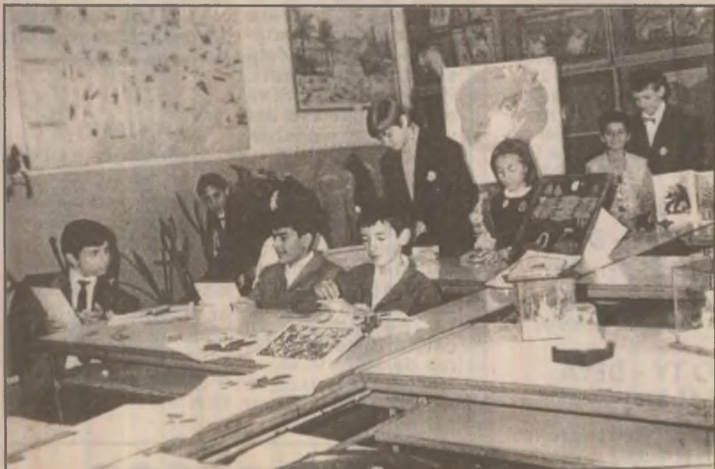
Laboratorul de biologie al Școlii Generale „Andrei Șaguna” din Deva