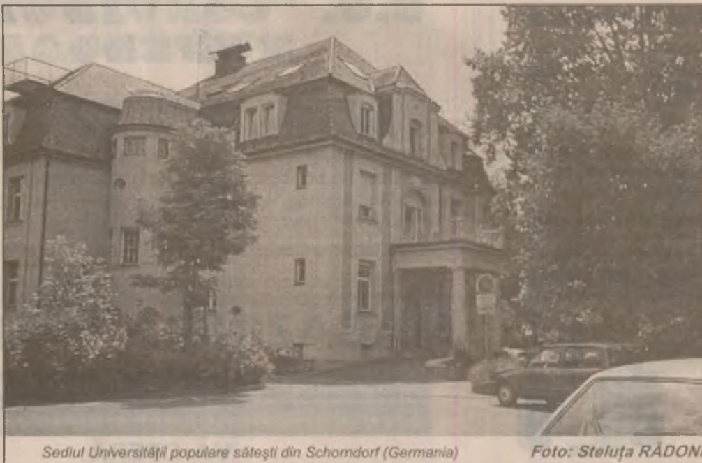
Sediul Universității populare sâsești din Schorndorf (Germania)

Cercetătorii de la Universitatea din Colorado au descoperit că exercițiile fizice făcute cu plăcere sunt mai bune decât cele făcute forțat, din obligație, informează REUTERS. Testele făcute pe șobolani au arătat că rozătoarele forțate să alerge pe o rotită au slăbit la fel de mult ca și cele lăsate să alerge când și cât au vrut. Însă sistemul imunitar al animalelor din primul grup era slăbit după cura de mișcare, în timp ce șobolanii care au alergat de plăcere aveau la finalul experimentului un sistem imunitar mai puternic decât la început.