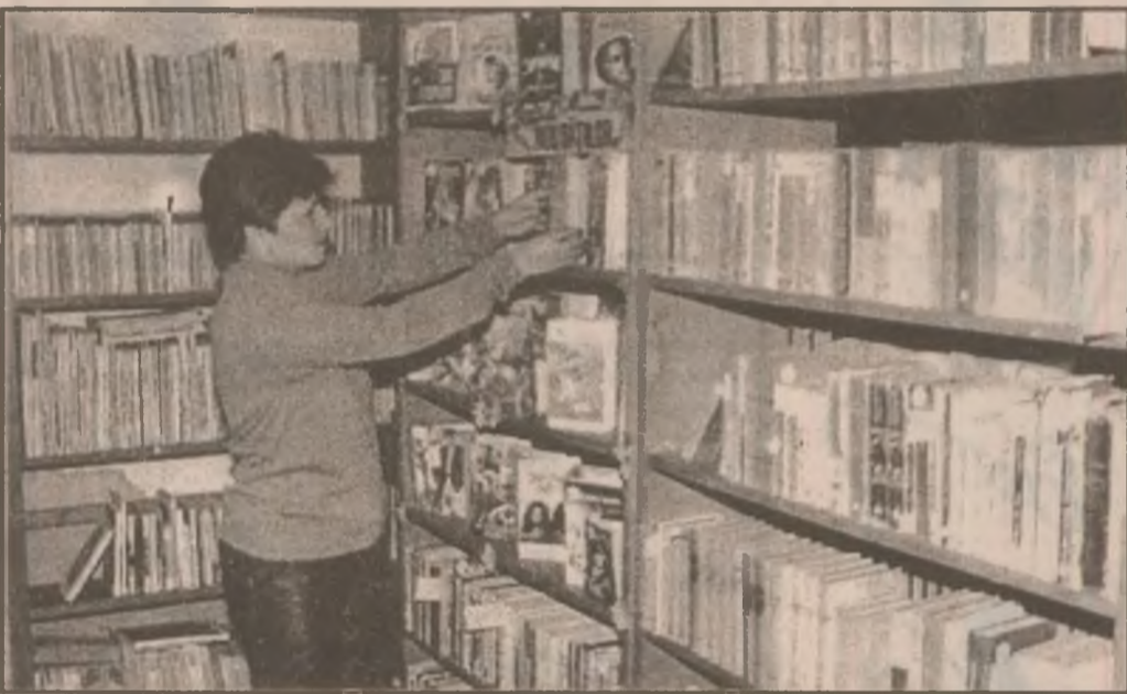
Aspect din Biblioteca din Orăștioara de Sus