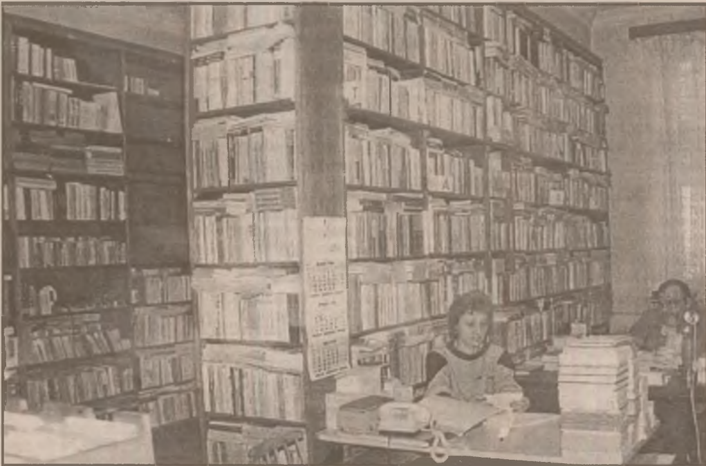
Aspect din biblioteca Clubului "Siderurgistul" din Hunedoara

Condamnată sau nu, actuala guvernare trebuie remaniată. Și asta cu cât mai repede cu atât mai bine. Pentru că un nou bilanț se apropie. În 29 noiembrie a.c. va fi rândul peședintelui țării, Emil Constantinescu, să-și prezinte bilanțul unui an de la alegerea în suprema funcție în stat. Poate atunci să auzim cu adevărat și de mai bine.