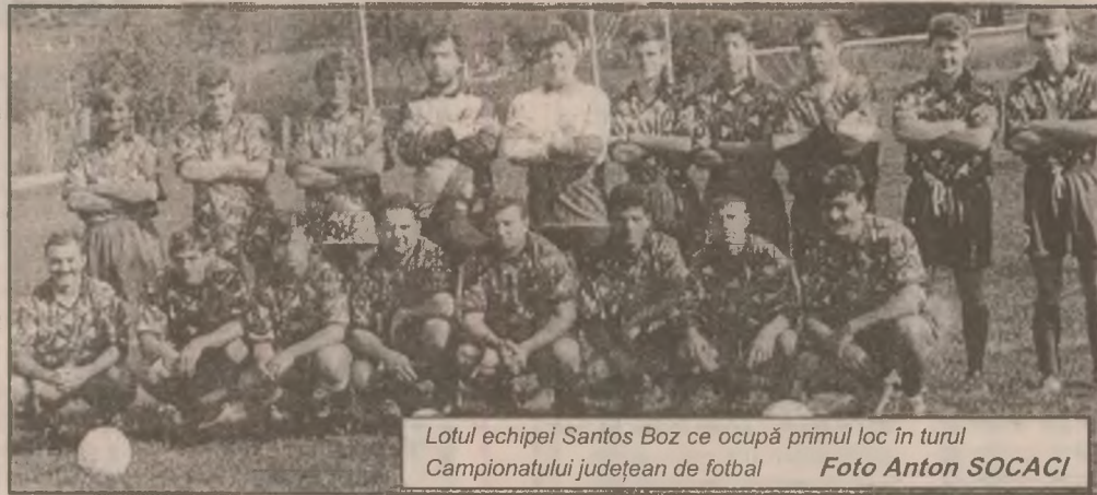
Lotul echipei Santos Boz ce ocupă primul loc în turul Campionatului județean de fotbal