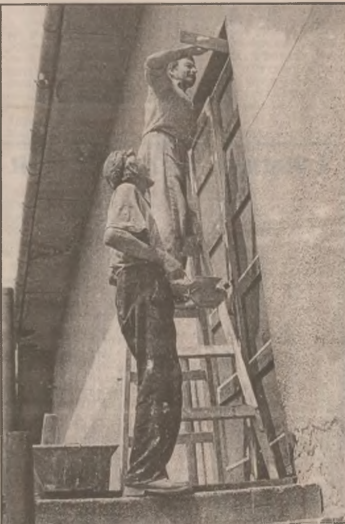
Meseria de zidar este foarte căutată. Pentru a fi renovate și modificate clădirile ce s-au construit până acum, este nevoie de mână de lucru calificată care este și bine plătită.

Este o mare durere pentru producători să nu-și poată valorifica producția și încasa banii cuvenți. Se poate oare ca lucrurile să continue și așa? Ce să mai spunem de miile de tone de porumb care nu-și mai găsesc beneficiarii? (N.T.).