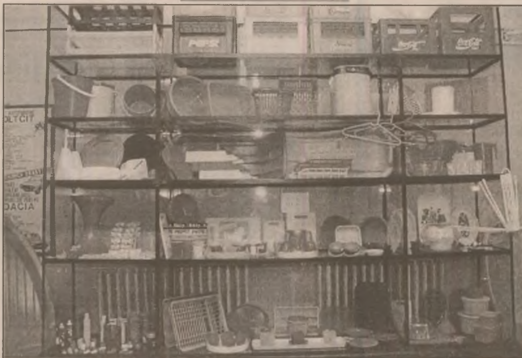
Produsele S.C. Chimica S.A. Orăștie - atât de căutate pe piață

Petre Roman, președintele Senatului României, susține că privatizarea băncilor și restructurarea marilor regiilor autonome (RENEL, Romgaz, Petrom ș.a.) trebuie să fie prioritatea viitoare a acțiunii guvernamentale. Restructurarea a fost hotărâtă în urmă cu câteva luni de coaliția aflată la putere, dar punerea sa în aplicare a întârziat. Potrivit președintelui Senatului, întârzierile au fost cauzate și de faptul că în România „privatizarea este un fel de trup cu două capete: F.P.S. și Consiliul pentru Reformă”. Se consideră că privatizarea și restructurarea, în ansamblul lor, trebuie să facă obiectul unei dezbateri viitoare la vârf în coaliția guvernamentală, care să identifice cauzele neaplicării programului guvernamental. (M.B.)