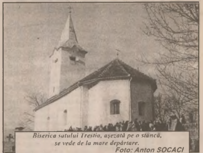
Biserica satului Trestia, așezată pe o stâncă, se vede de la mare depărtare.