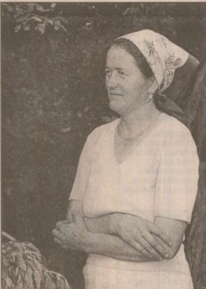
Liniștea și seninătatea femeii de la țară