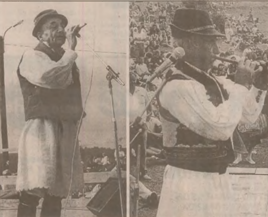
Doi interpreți ai cântecului popular pădurenesc