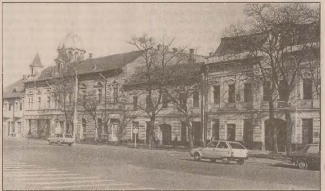
HUNEDOARA - centrul vechi

Tragedia cea mai mare o reprezintă, însă, imposibilitatea stopării acestei stări de fapt. Se pare că până vom vedea aici spectacole de teatru, de operă sau operetă, vom fi nevoiți să mai asistăm la destule astfel de "baluri" ale liceenilor care, în final, vor duce la distrugerea uneia dintre cele mai frumoase săli de spectacol, a treia ca mărime din țară.