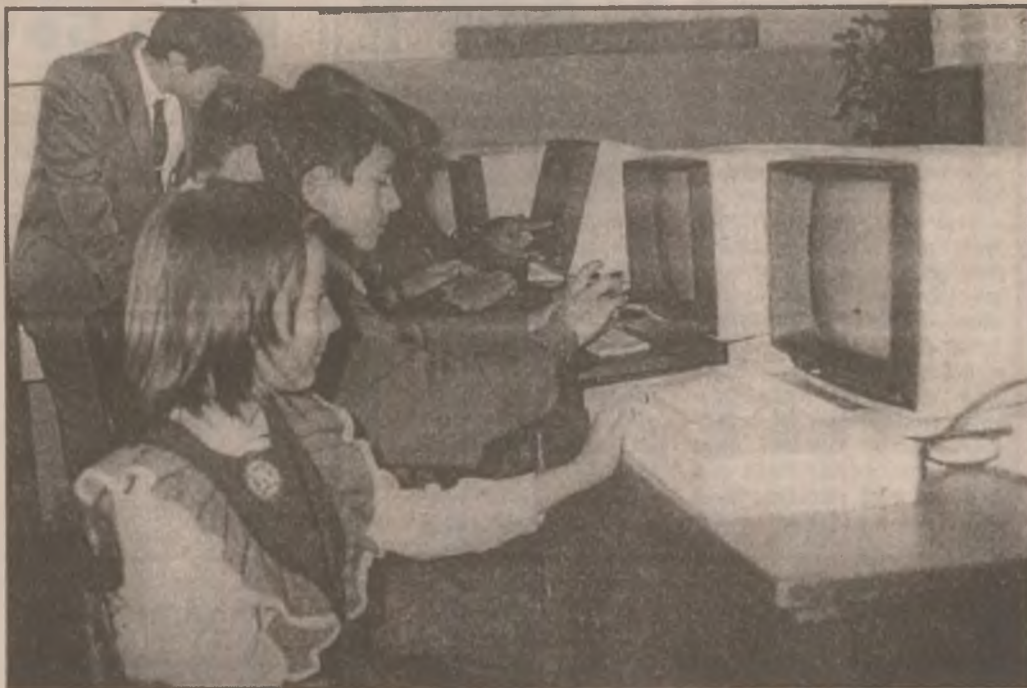
Foarte tinerii informaticieni ai Școlii „Andrei Șaguna” Deva și-au dobândit deja un prestigiu între colegii de generație.