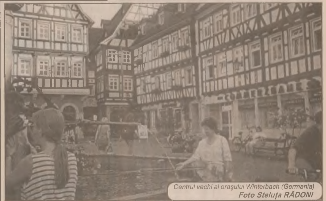
Centrul vechi al orașului Winterbach (Germania)