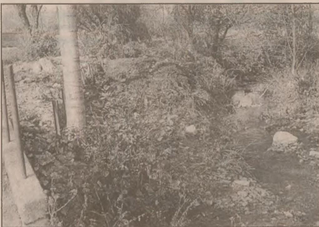
Peisaj de toamnă