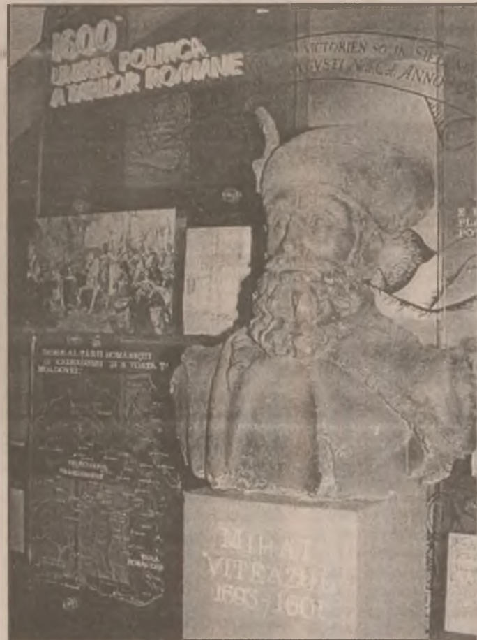
Momentul 1600 aflat sub zodia domnitorului Mihai Viteazul. Aspect din Muzeul Civilizației Dacice și Romane din Deva.

Vineri, 14 nov, Teatrul de Estradă Deva prezintă publicului devenind două spectacole în premieră. Pentru copii se va juca (de la ora 12.00) plesa „Noapte de Crăciun” (după C. Dickens) iar vârstelor mai mari le va fi oferit spectacolul „Revista în tranziție Divertis Show”, ce va începe la ora 17,30. (G.B.)