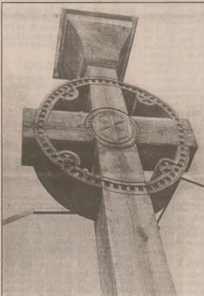
Troita - simbol al credinței românilor.