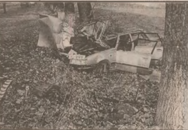
Trist, dar adevărat: Doi morți și... o mașină făcută zob.

Potrivit informațiilor primite de la unitatea abilitată ca distribuitor, până ieri s-au ridicat peste 146.700 cupoane de către agricultorii îndreptățiți din județul nostru, reprezentând mai mult de 86 la sută. Este în interesul agricultorilor ca până la data de 28 noiembrie a.c. să fie distribuite toate cupoanele ce le revin pentru campania agricolă de toamnă, în scopul utilizării lor. (N.T.)