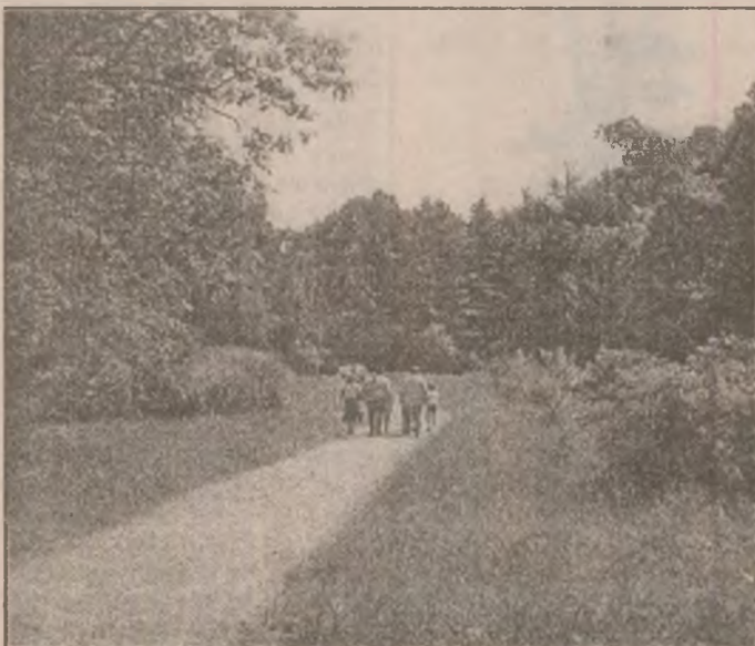
Alee cu Catalpa bignonioides , Pinus strobus și Juniperus virginiana (parcela 48, 50)