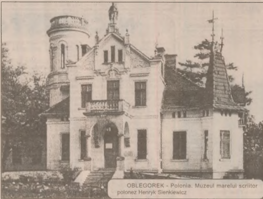
OBLEGOREK - Polonia. Muzeul marelui scriitor polonez Henryk Sienkiewicz

Președintele PD, Petre Roman, a afirmat că așteaptă explicații de la ministrul de externe, considerând că afirmațiile acestuia comportă "un anumit risc". Liderul PNȚCD, Ion Diaconescu, s-a disociat de criticile lui Severin, pe care le-a calificat drept "lipsite de tact".