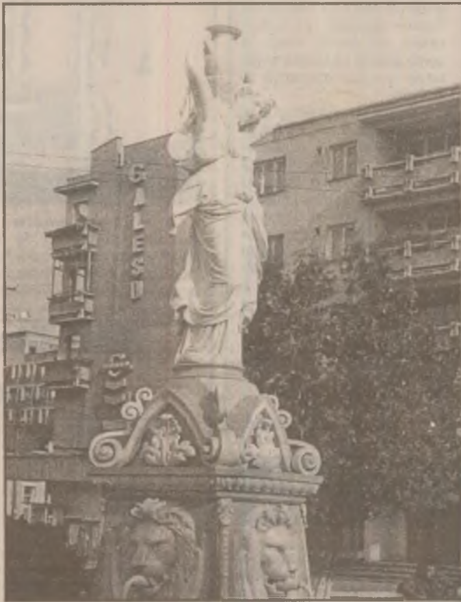
Imagine din centrul Hategului.