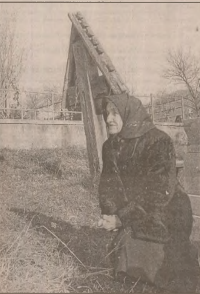
„Odihnește-i, Doamne, pe cei duși de la noi.”