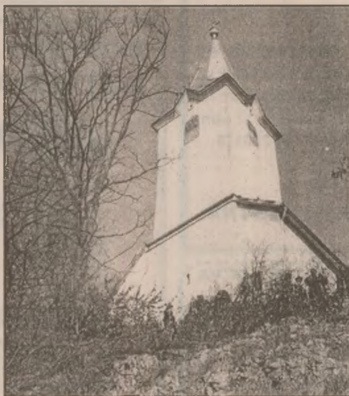
Restaurarea bisericilor - o preocupare statornică a credincioșilor, dovadă a credinței lor nestrămutate în Dumnezeu.

I.A.: Sunt absolvent de școală normală, unde am făcut multă aritmetică. Cred tare mult în Dumnezeu.