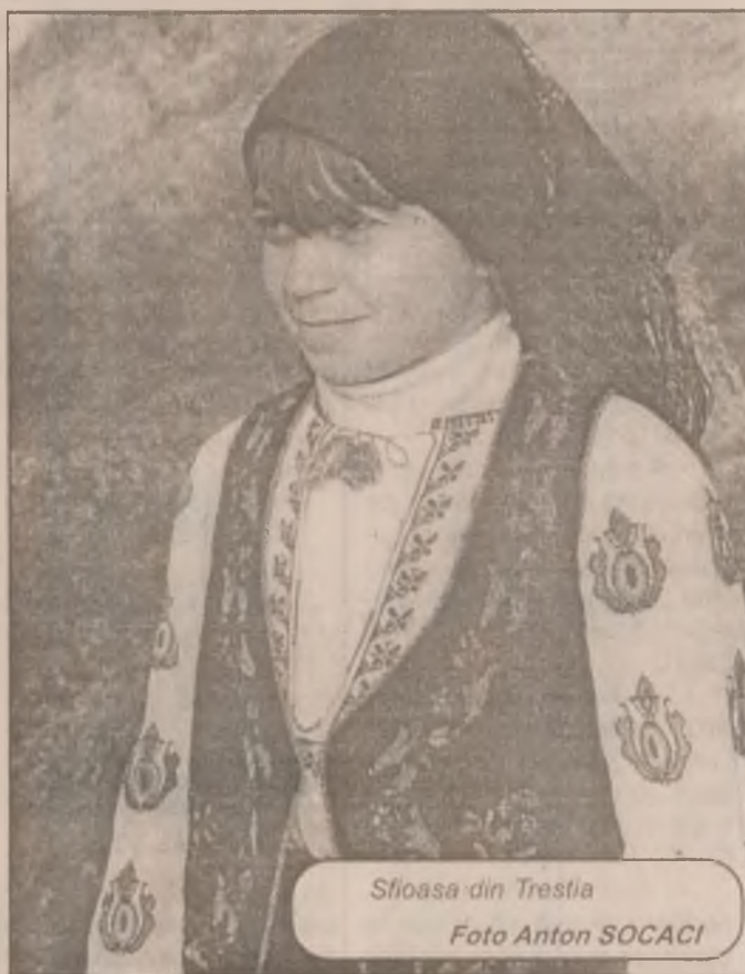
Sfloasa din Trestia