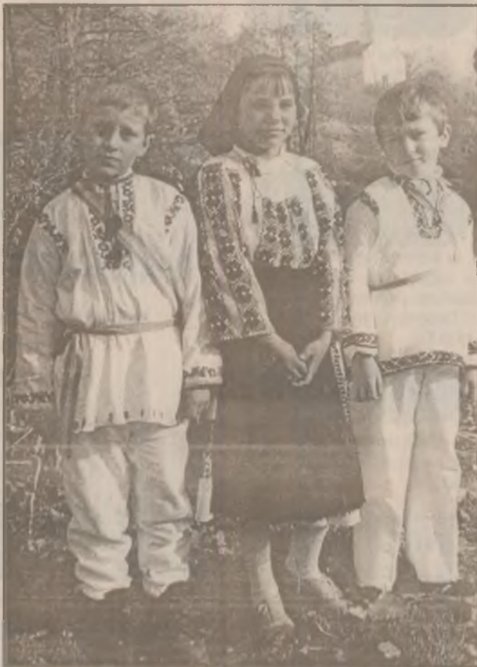
Copiii frumoși ai satelor noastre.

Pe de altă parte, același ministru încearcă o apropiere față de organizațiile și asociațiile de tineri din țară, prin propunerea de a colabora la realizarea Consiliului Tineretului din România, organism care ar urma să coordoneze activitatea organizațiilor amintite! (A.N.)