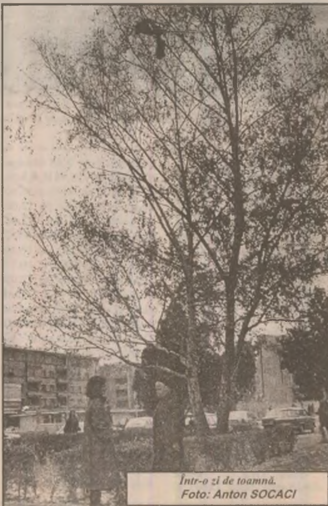
Intr-o zi de toamnă.