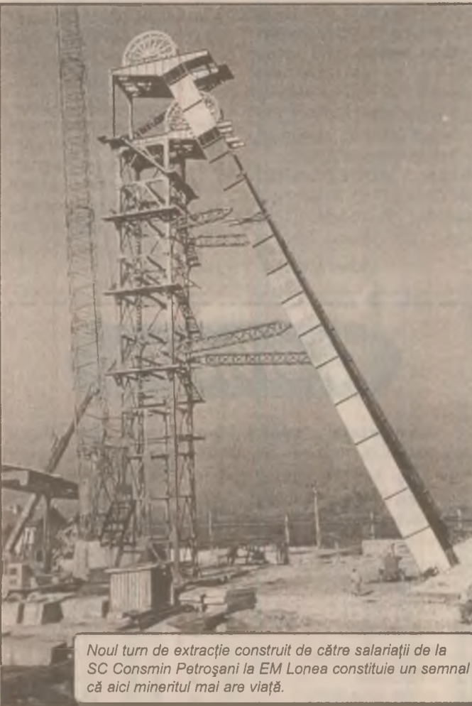
Noul turn de extracție construit de către salariații de la SC Consmi Petroșani la EM Lonea constituie un semn că aici mineritul mai are viață.

Cu alte cuvinte, revenind cu picioarele pe pământ, adică la realitate, este nevoie să fie schimbat macazul. Cu cât mai repede, cu atât mai bine. (N.T.)