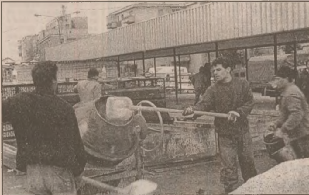
Piața Deveii. Lucrătorii de la Damai Comexim S.A. și Beta Com S.R.L. speră să încheie lucrările de modernizări în jurul datei de 10 decembrie a.c.