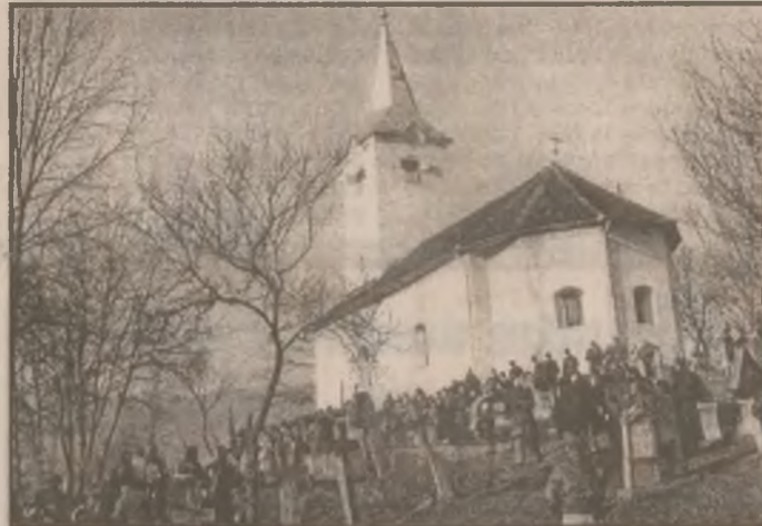
Biserica - locul unde se adună oamenii la fiecare sfință sărbătoare.

De la 1 ianuarie 1998, costul abonamentului la ziarul nostru este de 8000 de lei/lună plus taxele poștale.