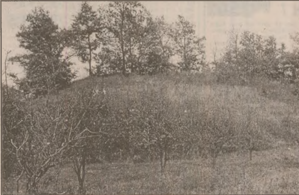
Peisaj de toamnă-iarnă!

de Nadudvar este de constatat că la vârsta de 12 săptămâni femela (curcă) ajunge la 6,6 kg, iar cocoșul (curcanul) la 8,6 kg. La 20 de săptămâni curca atinge 12 kg, iar curcanul 17,4, acesta din urmă cântărind 21,4 kg la 24 de săptămâni. De menționat că din 21,4 kg, carnea în carcasă reprezintă 16,7 kg. Datele prezentate de firma Nagisz SRL arată că aceasta produce, la Nadudvar, carne de curcan de 25 de ani, garantând calitatea produsului finit. Demonstrând spirit de competitivitate, firma urează partenerilor performanțe mai bune. (N.T.)