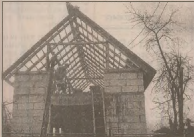
Să sâdești un pom, să construiești o casă...

Cei prezenți s-au întretinut cu execuții și cu beneficiarii DN 7, după care și-au urat „Drum bun!” (D.G.)