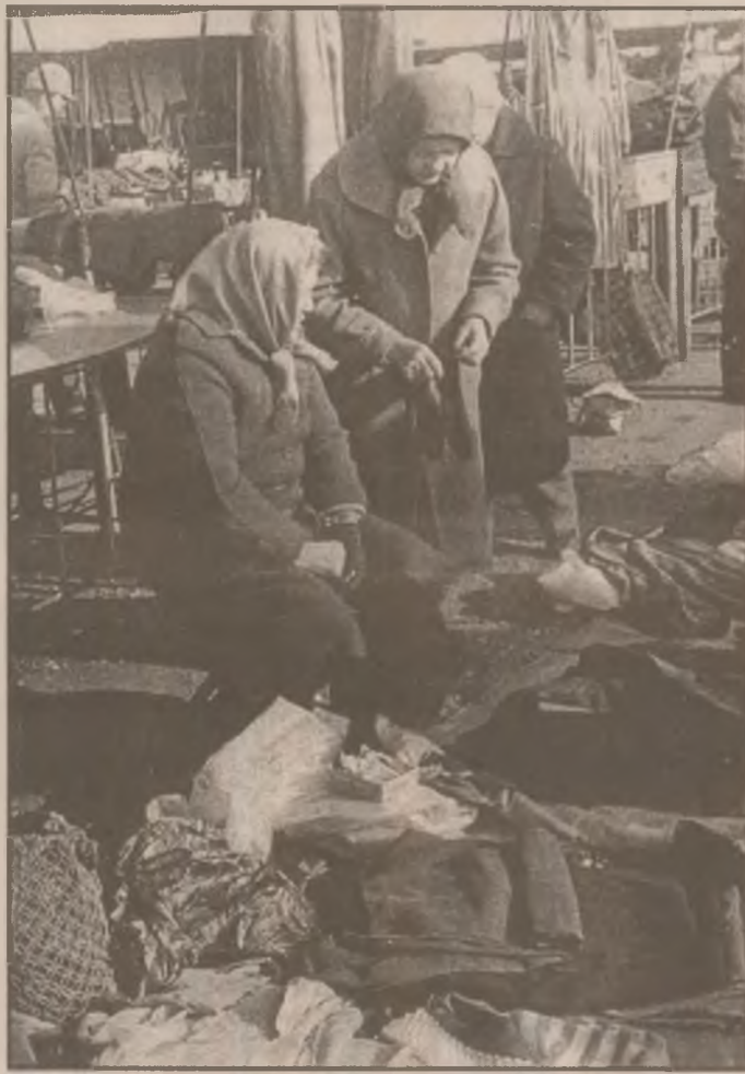
La „piața rușilor” din Deva se găsesc de toate și la prețuri acceptabile chiar și pentru vârsta a treia.

❖ Alifia împotriva arsurilor se realizează amestecând 100 g miere cu 100 g glicerină. Aplicată pe arsură efectele apar imediat.