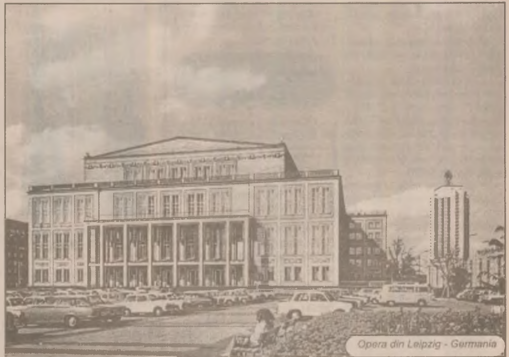
Opera din Leipzig - Germania

luna noiembrie inflația va fi mai mică de 5%, iar pentru anul viitor aceasta nu va depăși o rată lunară de 3%. În luna februarie, în momentul încheierii acordului de împrumut cu FMI, prognozele oficiale indicau o rată a inflației pentru această perioadă de 1,5% - 2,2% și o rată anuală (decembrie 1996 - decembrie 1997) de 90%. Ca urmare a unor corecții mai accentuate ale prețurilor, în vară a fost modificată prognoza, estimându-se un nivel de 130% pentru acest an. În acest moment și acest nivel a fost depășit, creșterea prețurilor de consum față de decembrie 1996 fiind de 130,7%. Rata inflației a fost în luna octombrie de 6,5%.