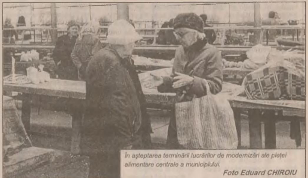
În așteptarea terminării lucrărilor de modernizare ale pieței alimentare centrale a municipiului.

Oare trebuie bătute în cuie sau unii oameni sunt...bătuți în cap?!