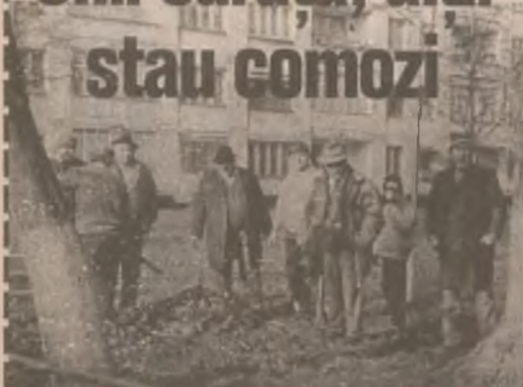
Mai mulți locatari din cadrul Asociației nr.2 Hunedoara curăță zonele verzi.

La finele săptămânii trecute, sâmbătă, 21 noiembrie, pe strada 22 Decembrie, în zona blocurilor CM 3 - Asociația nr.2 din Hunedoara - un grup de locatari, cu greble și alte unelte agricole, făceau curățenie de zor pe zonele dintre blocuri.