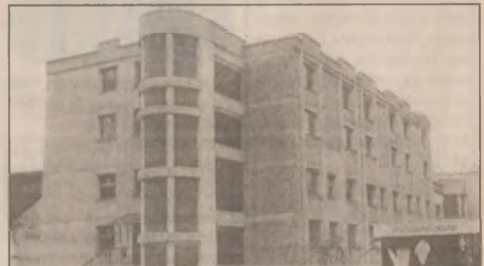
Situația imobilului din vecinătatea Grupului Școlar "Transilvania" a generat zile întregi mitinguri de protest, conferințe de presă, demersuri la ministrul transporturilor etc.