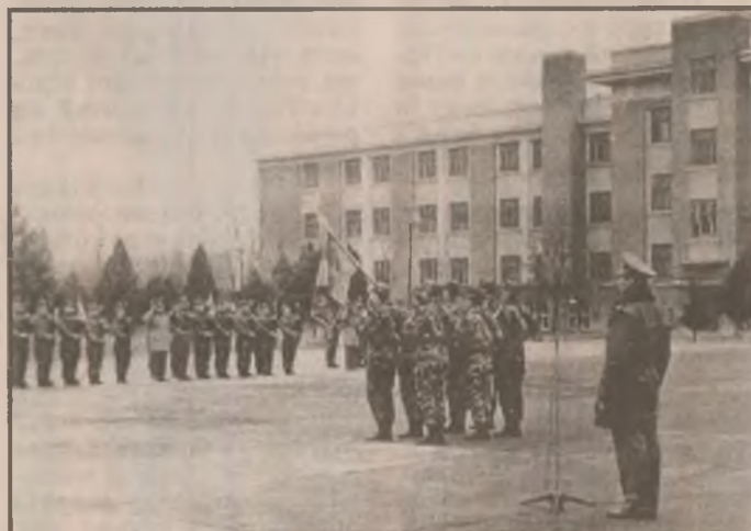
Aspect de la depunerea jurământului de credință față de țară la U.M. Deva. În prim-plan drapelul unității.