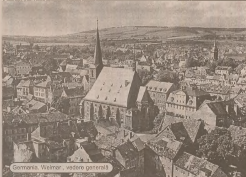
Germania, Weimar, vedere generală

La rândul său, Valeriu Tabără a solicitat Biroului Permanent al Camerei Deputaților "să nu acorde nici o semnificație politică" scrisorilor transmise de Gheorghe Funar. "Împotriva lui Funar conducerea PUNR a înaintat un denunț penal la Parchetul General de pe lângă Curtea Supremă de Justiție, având în vedere faptele deosebit de grave săvârșite de acesta pentru uzurparea de calitate oficială, sustragerea de înscrisuri, falsificarea instrumentelor oficiale, uz de fals, fals în declarații", a precizat Tabără în scrisoarea lui.