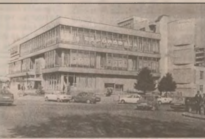
Imagine din Deva - municipiul reședință de județ.