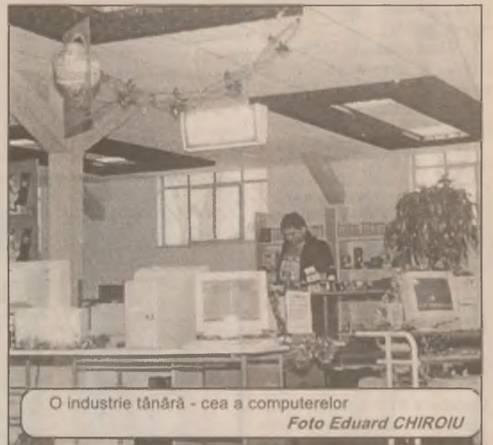
O industrie tânără - cea a computerelor