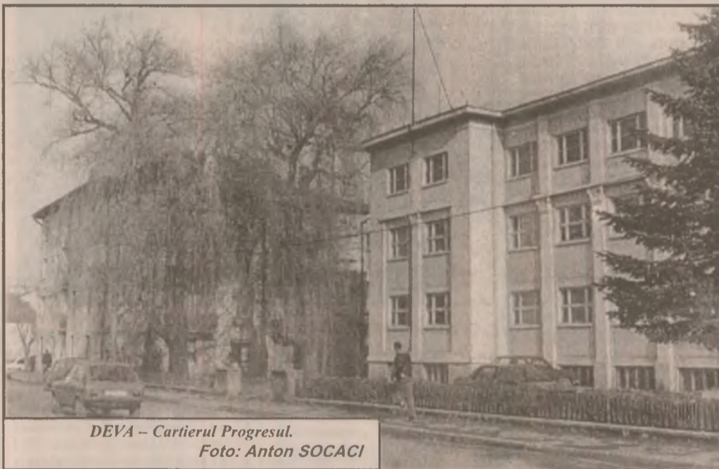
DEVA - Cartierul Progresul.

Rezultatul: în acest an, prejudiciile cauzate avutului privat la nivelul municipiului Brad sunt de aproximativ 150.000.000 de lei! (V.N.)