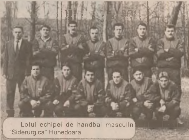
Lotul echipei de handbal masculin "Siderurgica" Hunedoara