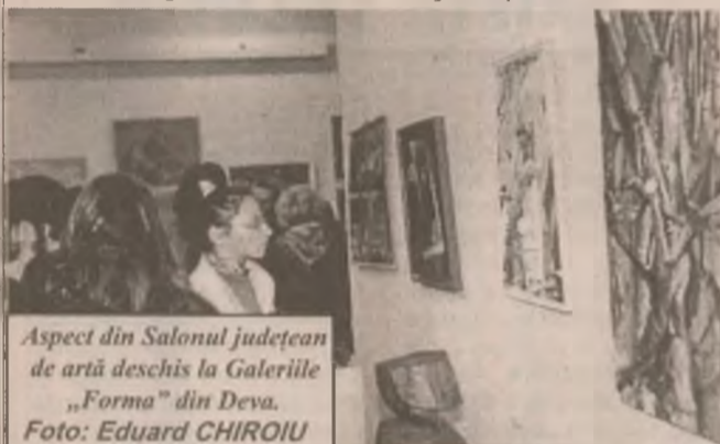
Aspect din Salonul județean de artă deschis la Galerile „Forma” din Deva.

La sfârșit de an, ne alăturăm și noi tradiționalelor urări de sărbători, făcute artiștilor plastici cu acest