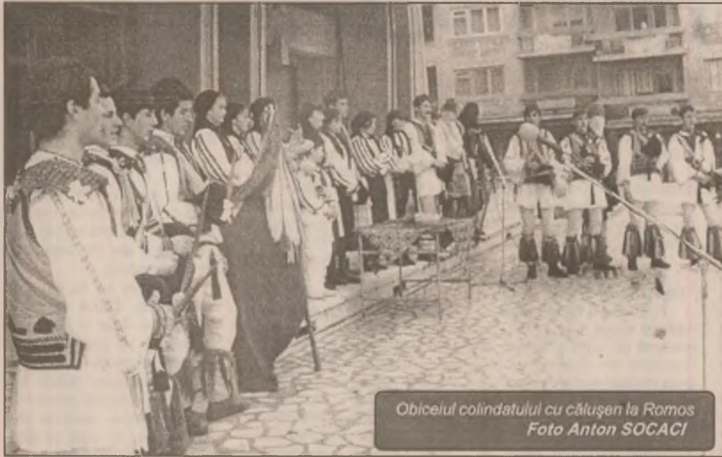
Obiceiul colindatului cu călușen la Romos