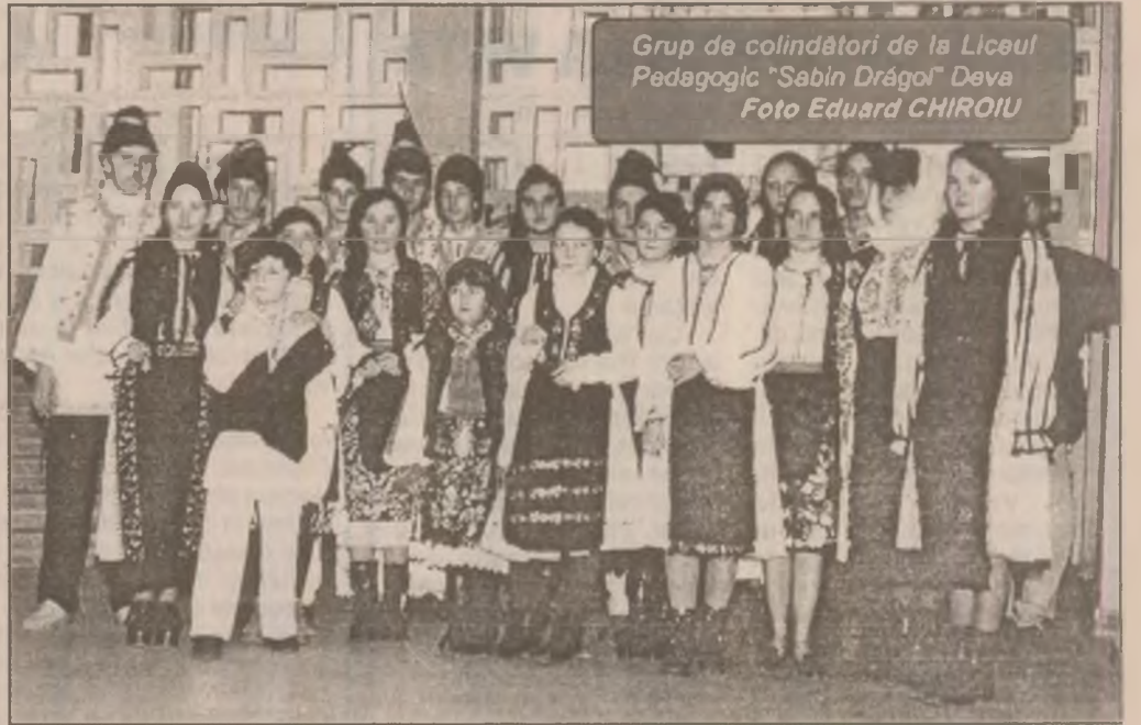
Grup de colindători de la Liceul Pedagogic "Sabin Drăgoi" Deva