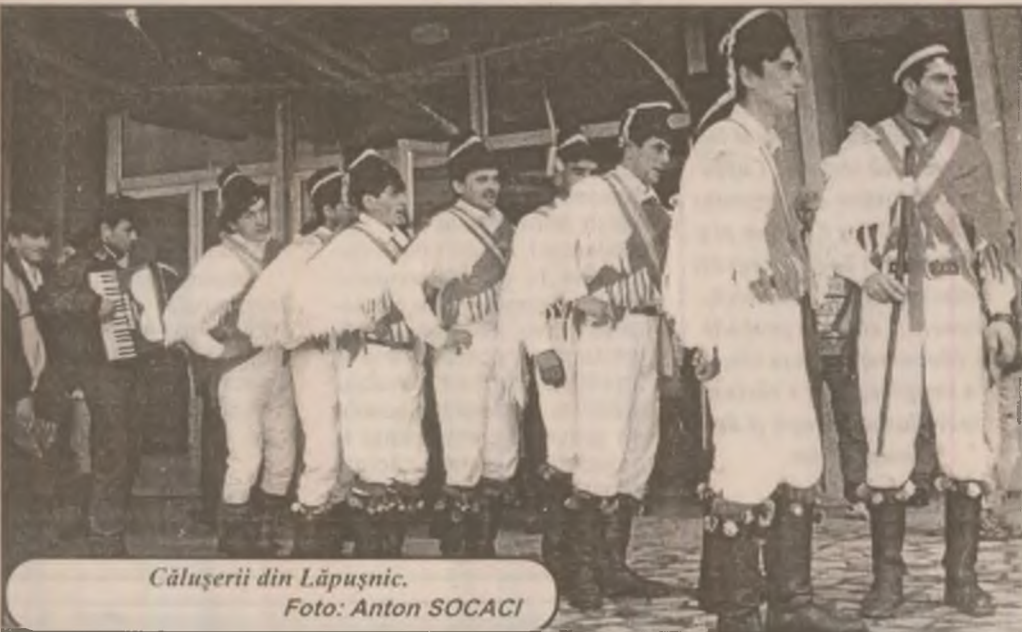
Călușerii din Lăpușnic.