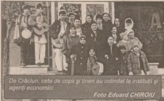
De Crăciun, cete de copii și tineri au colindat la instituții și agenți economici