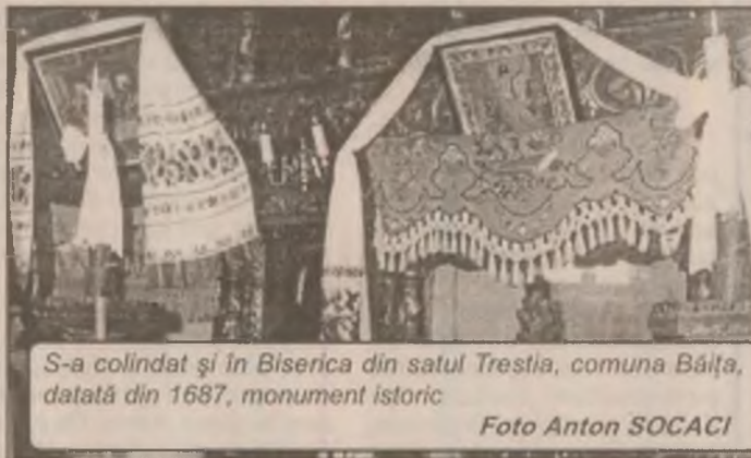
S-a colindat și în Biserica din satul Trestia, comuna Băița, datată din 1687, monument istoric