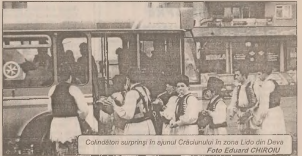
Colindători surprinși în ajunul Crăciunului în zona Lido din Deva