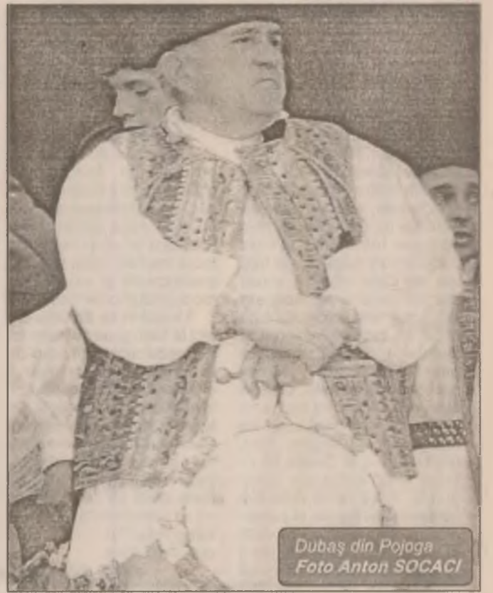
Dubaș din Pojoga