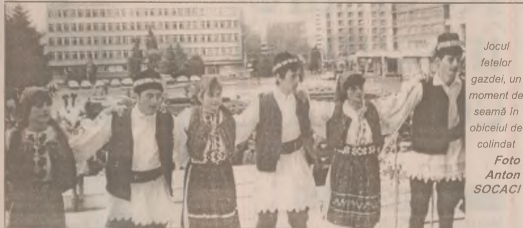
Jocul fetelor gazdei, un moment de seamă în obiceiul de colindat

Acest obicei, al colindatului, cuprinzând întreaga Transilvanie, cu mici zone insulare unde nu se practică, diferite zone din Muntenia și anumite ținuturi chiar din Moldova, merită să fie elogiat. În ceea ce privește repertoriul de colinde, se remarcă o varietate deosebită pe plan teritorial, dar colinda fiind prin esență un cântec de felicitare de început de an, plămănit inițial pentru a corespunde unor anumite stări și aspecte, se înregistrează o mare varietate și pe plan funcțional.