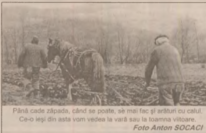
Până cade zăpada, când se poate, se mai fac și arături cu calul. Ce-o ieși din asta vom vedea la vară sau la toamna viitoare.

Și totuși, spunem noi, țărani din Sarmizegetusa au arătat că pot ajunge la un compromis, fiind dispuși să renunțe la pământ pentru o sumă corectă de bani. După cum am văzut la fața locului, numărul celor dispuși să facă asta este destul de mare și, probabil, în viitor va fi și mai mare. Ei trebuie plătiți însă în mod corespunzător.