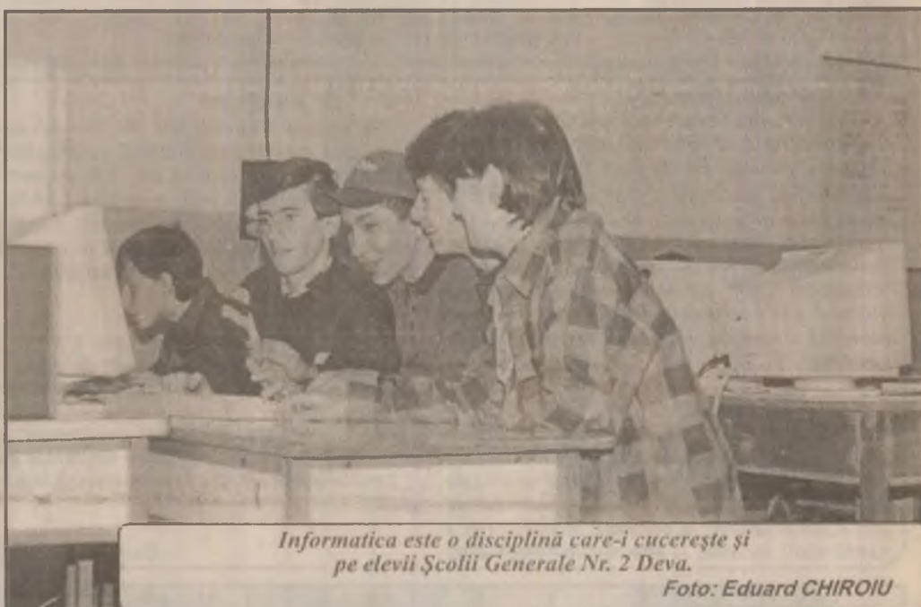
Informatica este o disciplină care-i cucerește și pe elevii Școlii Generale Nr. 2 Deva.