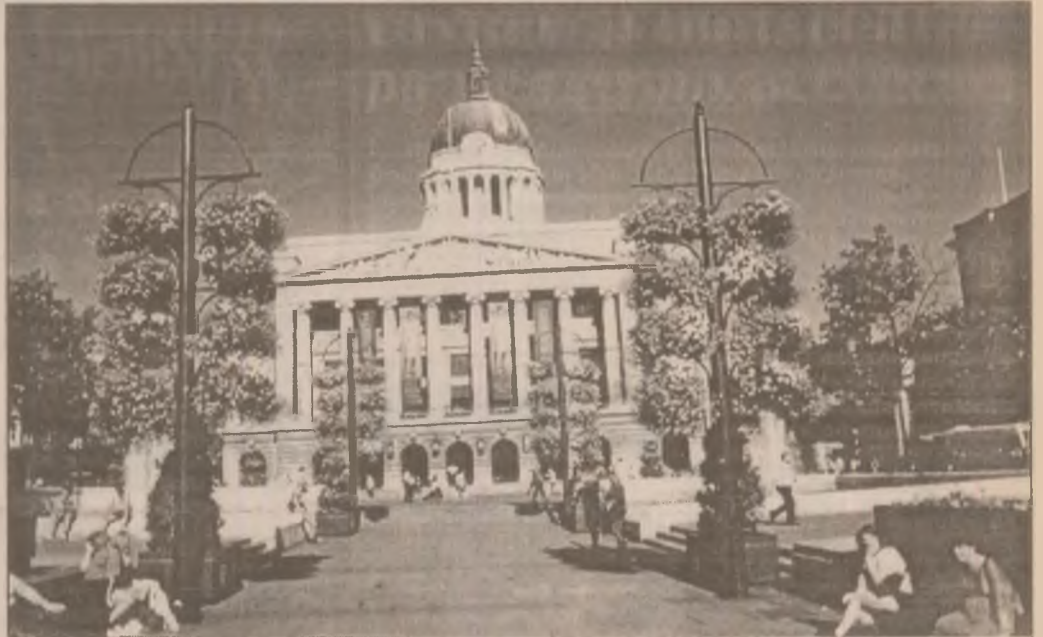
Nottingham. Piața „Old Market”.

Rezerva de aur a fost, la sfârșitul anului 1996, de 87,7 tone, cu 3,7 tone mai mult, creșterea rezervei provenind din producția internă și din conversia în aur a 96 tone argint.