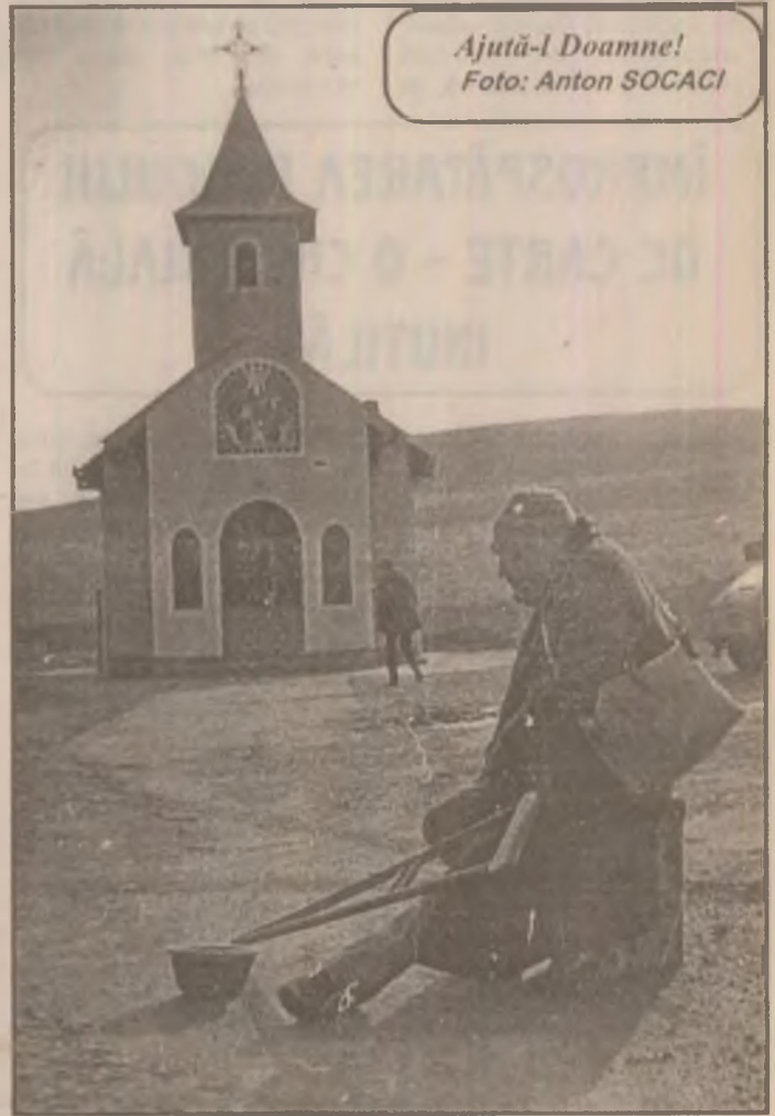
Ajută-l Doamne!