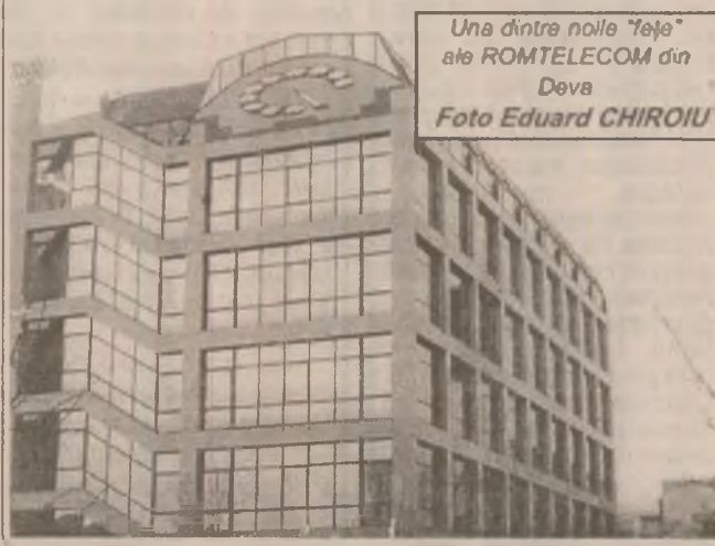
Una dintre noile "fațe" ale ROMTELECOM din Deva

În încheiere mai facem o precizare ca răspuns la o serie de întrebări sosite la redacție. Este vorba de justificarea cifrei înscrise în dreptul "modificări tarife" de pe facturile telefonice primite în luna ianuarie. Acea sumă reprezintă diferența dintre suma plătită, în avans, în luna decembrie pentru ianuarie, la tarifele în vigoare atunci pentru abonamentul telefonic și noua taxă de abonament care a intrat în vigoare în luna ianuarie. Ea este specifică doar lunii ianuarie, fiind o corecție necesară pentru alinierea la noul tarif al abonamentului intrat în vigoare la începutul anului, dar care a fost plătit, în avans, în decembrie.