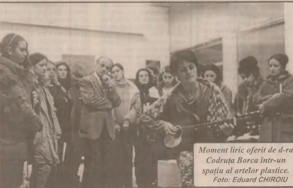
Moment liric oferit de d-ra Codruța Borca într-un spațiu al artelor plastice.