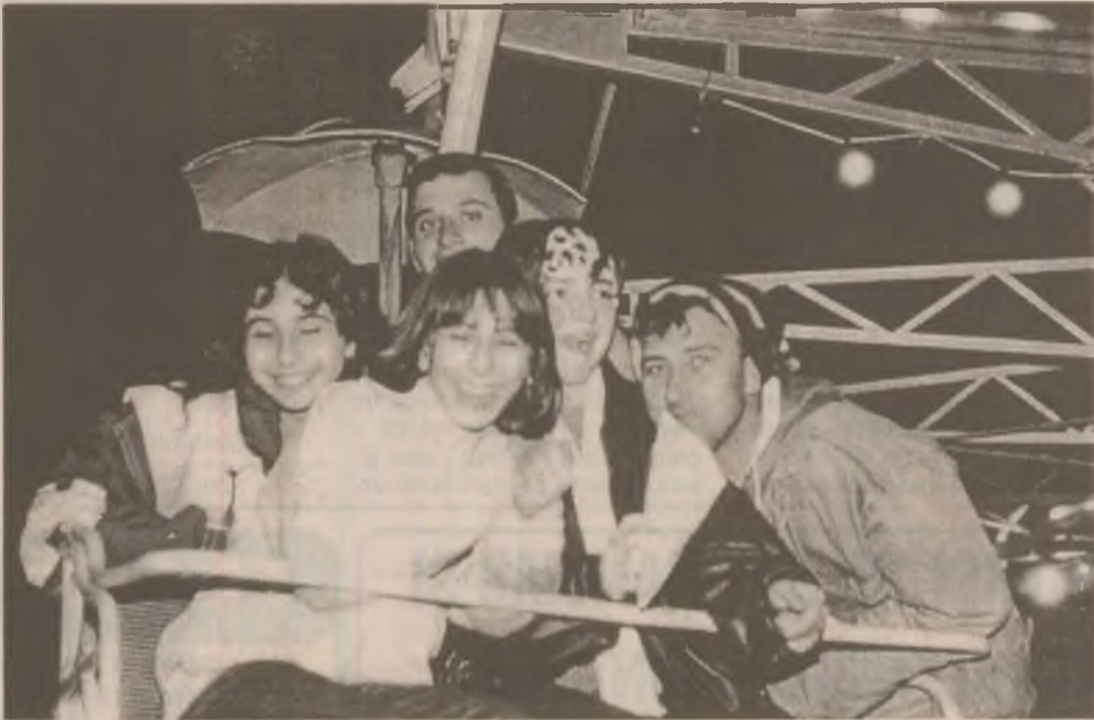
Un strop din bucuriile tinereții.