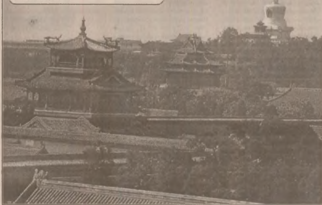
Beijing - Pavilionul "Ploaia florilor" din Palatul imperial.

La sfârșitul lunii octombrie 1997, Duma de stat (Camera inferioară a parlamentului), care este dominată de conservatorii pro-comuniști, a sesizat Curtea constituțională, cerându-i să se pronunțe asupra legalității unei a treia candidaturi a lui Elțin. Curtea constituțională a anunțat că își va da verdictul în această problemă abia în a doua jumătate a anului 1998.