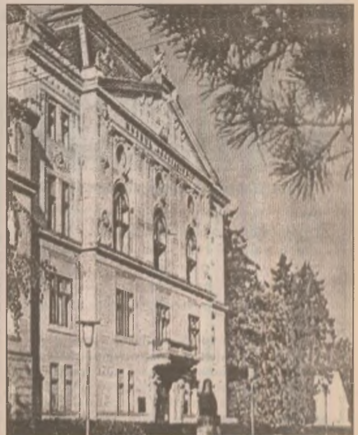
Biblioteca "ASTRA" din Sibiu

Peștera tânăra Nestăvilită apa spumegând taie piatra fragedă sculptând istovită, apoi, un firicel se zbate jos mărind tăcerea bolților înalte.