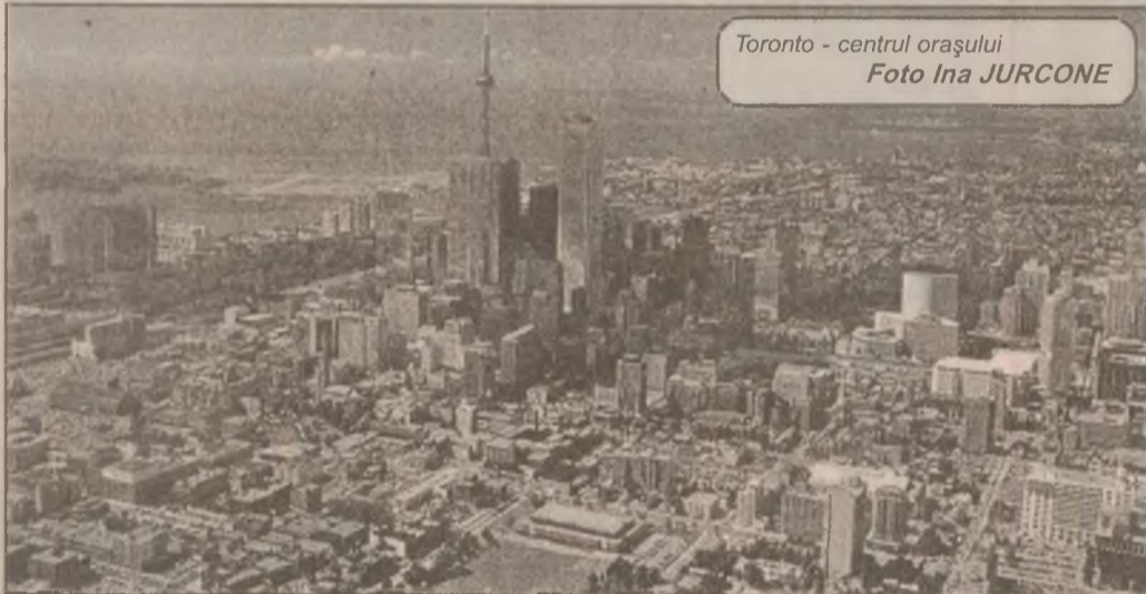
Toronto - centrul orașului