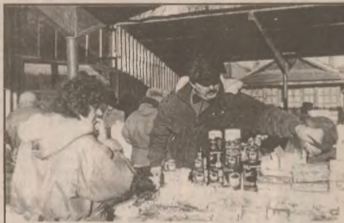
Cu atâtea sortimente și prețuri, alegerea devine grea, inclusiv la piața din Brad.