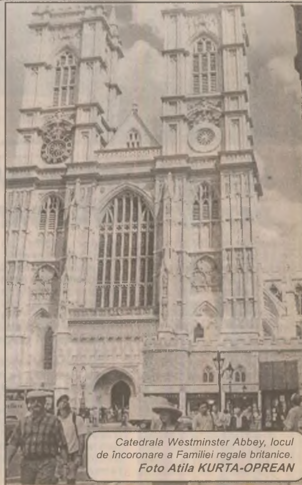
Catedrala Westminister Abbey, locul de încoronare a Familiei regale britanice.

gurarea lui, în 1973, muzeul Van Gogh nu a mai efectuat niciodată un asemenea împrumut. Tablourile alese evocă diferitele perioade ale artistului, de la lucrările de tinerețe, executate în Olanda, până la întâlnirea sa cu expresionismul francez, în 1886 și ultimele tablouri de la Anvers-Sur-Oise.