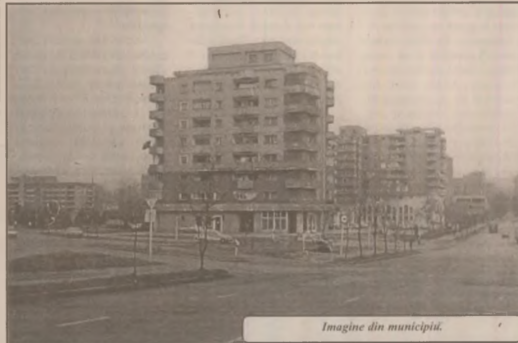
Imagine din municipiul.

- În acest ianuarie, peste 1000 pe care ne străduim să le ducem cât mai repede la cititori. Mașinile noastre străbat zilnic cinci trasee. Oficiul nu este cel mai mare din județ, dar acoperă o zonă dificilă cum este zona Pădurenilor.