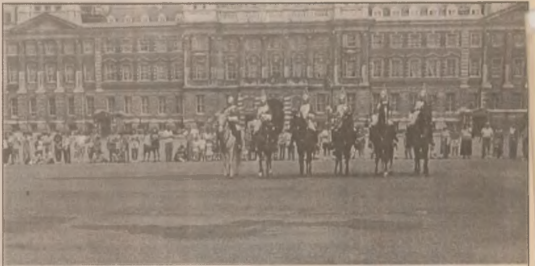
Londra - Pe esplanada Horse Guard, la ora 11 00 are loc schimbarea gărzii călare, ceremonie ce atrage zilnic sute de turiști din toate colțurile lumii.

Aceste propuneri sunt inacceptabile pentru noi, mai ales că însuși președintele României a recomandat ca etalon salariului mediu pe economie, a conchis Naumescu.