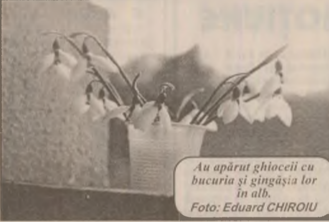
Au apărut ghiocelii cu bucuria și gingașia lor în alb.