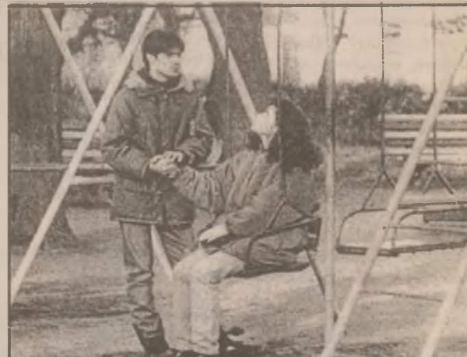
Bucuria unei străngeri de mână.