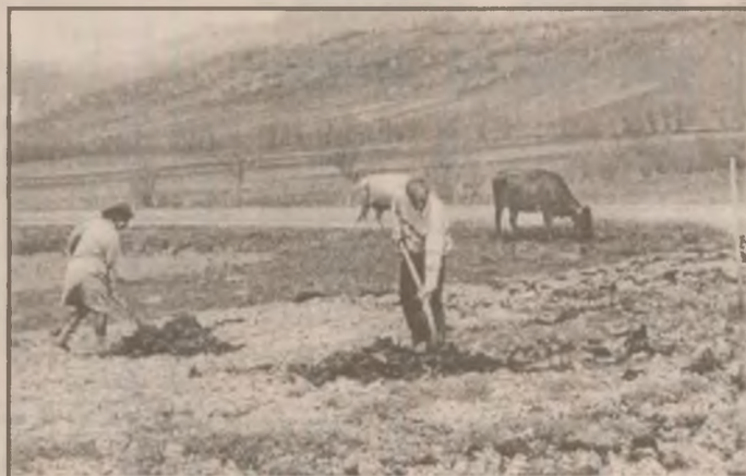
Dacă în această iarnă n-am prea avut parte de zăpadă, agricultorii mai ies în câmp să facă lucrările de fertilizare.

purced la drum, însoțite de vizitii. Și, când în balanță stă viața unui om, nu contează de-i vreme bună sau rea, de-i soare sau viscol, dacă lemnele trosnesc de gerul iernii. Pentru locuitorul acestei comune, bolnav fiind, luptându-se cu moartea, ce poate fi mai minorat decât pricepera și cunoștințele unui cadru medical și o șaretă ajunsă la timp. Sunt singurele care îi mai pot prelungi existența.