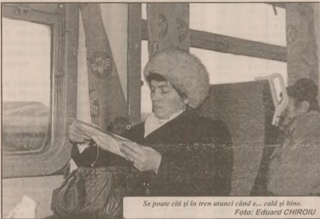
Se poate citi și în tren atunci când e... cald și bine.

Despre forța mecanică a comunei Lăpugiu de Jos ne vorbesc cât se poate de expresiv și cele 78 de tractoare aflate în proprietate privată. Din acestea 36 se găsesc în satul Lăpugiu de Sus, unde gradul de mecanizare la lucrările agricole și, în mod deosebit, transporturile au cunoscut un impuls aparte în ultimii ani.