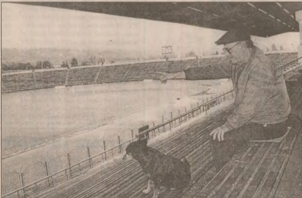
În așteptarea reluării meciurilor amicale și a returului campionatului la Jiul Petroșani.