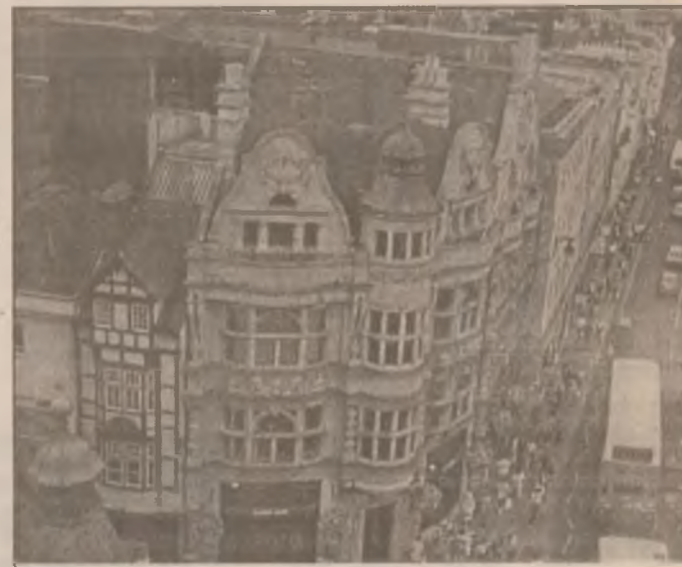
Oxford, vechi centru universitar britanic, ale cărui prime colegii au fost înființate în secolul XI

"Restricțiile anunțate urmăresc disciplinarea agenților economici, pentru încadrarea consumurilor în nivelele contractuale stabilite și efectuarea la timp a plăților", a încheiat directorul.