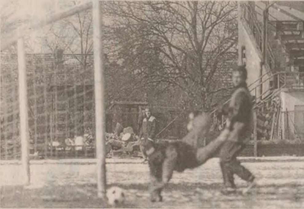
Una dintre multele ocazii avute de Vega Deva la poarta gazdelor - CFR Marmosim este din nou salvată de portar.