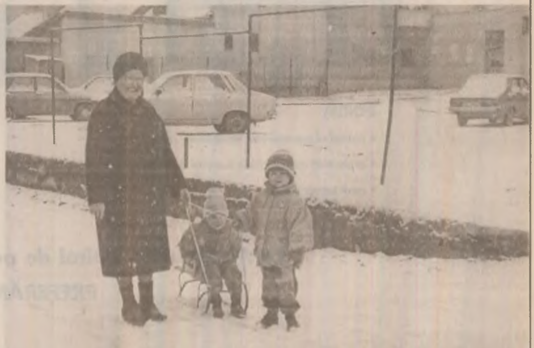
Bucuriile celor mici împărtășite de bunici.