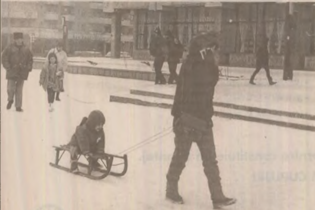
Mama, tot mamă, chiar dacă o doare măseaua își plimbă copilul.