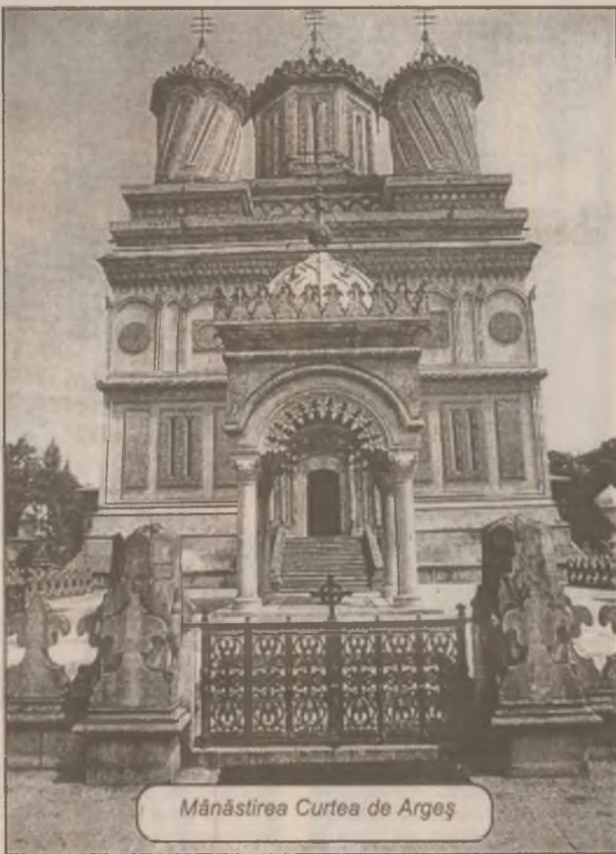
Mănăstirea Curtea de Argeș

Grupul industrial francez este hotărât să fie prezent permanent la București și să investească în proiecte care vor fi derulate începând cu acest an.