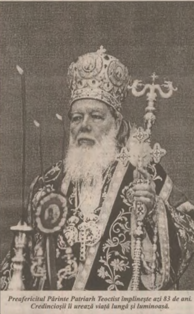
Preafericitul Părinte Patriarh Teoctist împlinește azi 83 de ani. Credincioșii îi urează viață lungă și luminoasă.