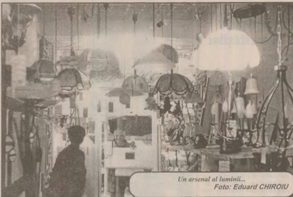
Un arsenal al luminii...

Polițiștii hunedoreni atrag în continuare atenția participanților la trafic că iarna nu a trecut și că este posibil în orice moment ca automobilul să prindă o porțiune de gheață și să intre în derapaj.