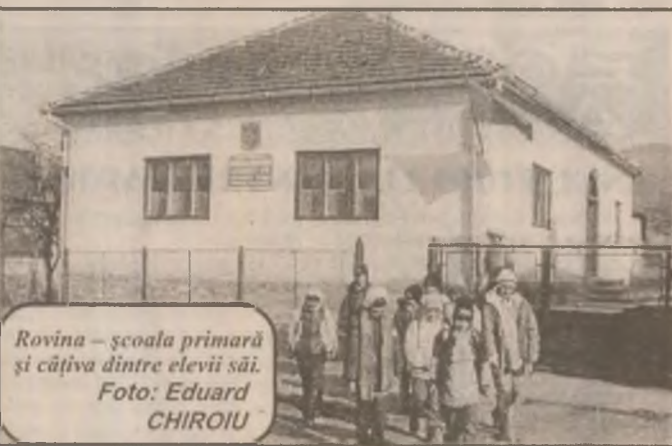
Rovina - școala primară și câțiva dintre elevii săi.