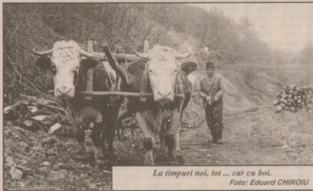
La timpuri noi, tot ... car cu boi.