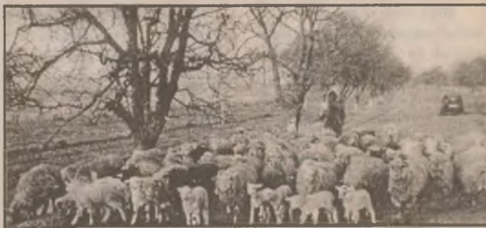
Profitând de iarna fără zăpadă oile au ieșit la păscut, cu mieii cu tot.

Sindicaliștii mai solicită recunoașterea Recomandării UNESCO - OIM privind Statutul profesorilor, stoparea oricăror tentative de promovare în funcții de conducere pe criterii politice ș.a. "Dacă Guvernul României nu dă curs solicitărilor noastre până la termenul limită de 15 martie 1998", se arată în rezoluția Consiliului Național al FEN, după consultări cu FSLI și FSI "Șpiru Haret", acestea vor declanșa greva generală. (G.B.)