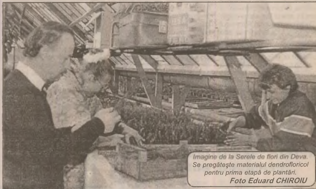
Imagine de la Serele de flori din Deva. Se pregătește materialul dendrofloral pentru prima etapă de plantări.

Ca o concluzie, putem spune că, deși soarta evreilor din România nu este dintre cele mai roz, ei pierd cu demnitate viitorul. Comunitatea se stinge încet, însă în urmă rămân faptele, care au contribuit la formarea acestui popor.