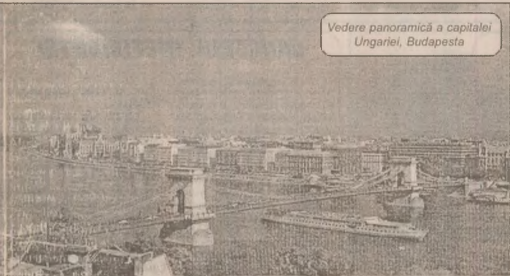
Vedere panoramică a capitalei Ungariei, Budapesta

Cooperarea trilaterală are ca obiectiv principal coordonarea pozițiilor în forurile internaționale, în special în ceea ce privește integrarea europeană, cooperarea în problemele durabile, lupta împotriva crimei organizate, interzicerea minelor antipersonal, perfecționarea serviciului de control la frontieră, cooperarea în structurile regionale și subregionale (ICE, CEFTA și SECI).