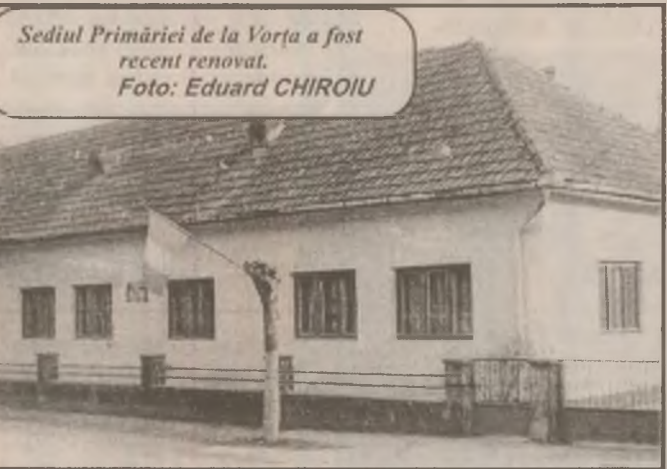
Sediul Primăriei de la Vorța a fost recent renovat.

Însă, nu încapă îndoială, caracterul satiric-moralizator al acestor strigăte este vădit, acum ivindu-se prilejul să fie ironizați, în