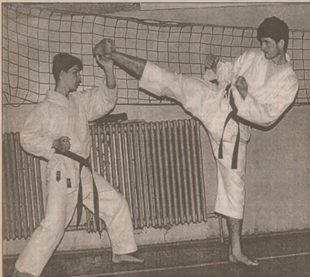
Un Yoko - GERI la mare "înălțime"