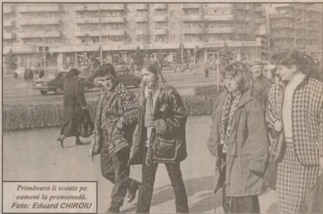
Primăvara îi scoate pe oameni la promenadă.