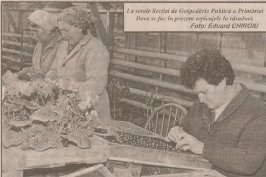
La serele Secției de Gospodărie Publică a Primăriei Deva se fac în prezent repicașele la răsaduri.