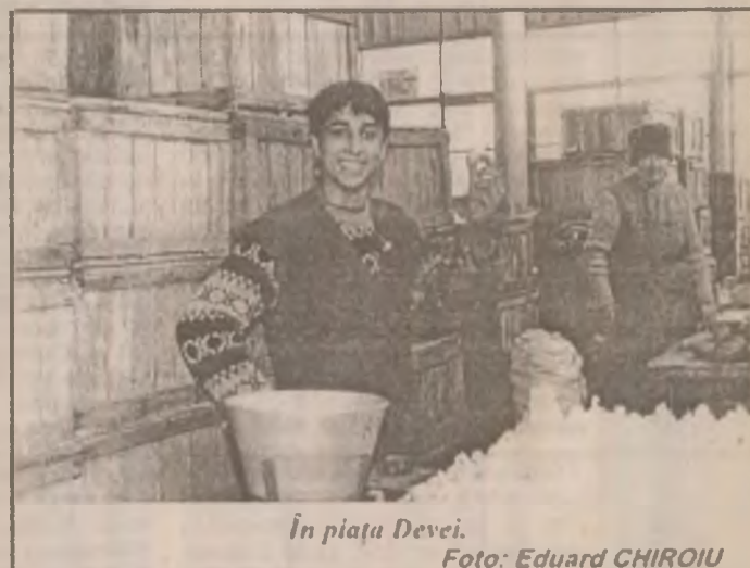
În piața Devei.