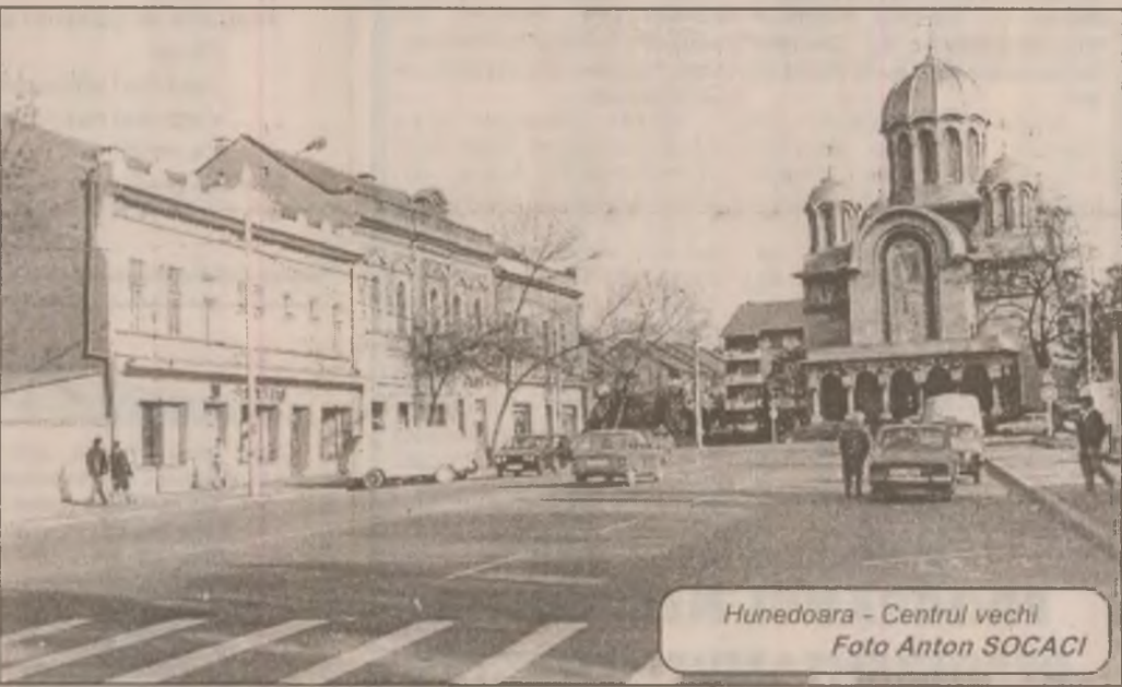
Hunedoara - Centrul vechi

Piața "Obor" din Hunedoara se remarcă nu doar prin varietatea și bogăția ofertei, ci și prin aspectul plăcut și îngrijit. Prețurile sunt și ele mici decât în alte orașe. Spre exemplu, cartofii costă 2500-3000 de lei kilogramul, usturoiul se vinde cu 12000-15000 de lei, ceapa cu 6000, salata verde cu 2500 de lei căpățâna, iar merele cu 1500-2000 lei kilogramul. Castraveții costă 17000-18000 de lei, roșiile sunt și ele cam la același preț, adică 18000 de lei. Laptele se vinde cu 4000 de lei litrul, portocalele costă 5900-6000, iar bananele 10000 de lei kilogramul. Trandafirii sunt mai ieftini decât în alte piețe și se vând cu 11000-12000 de lei firul.